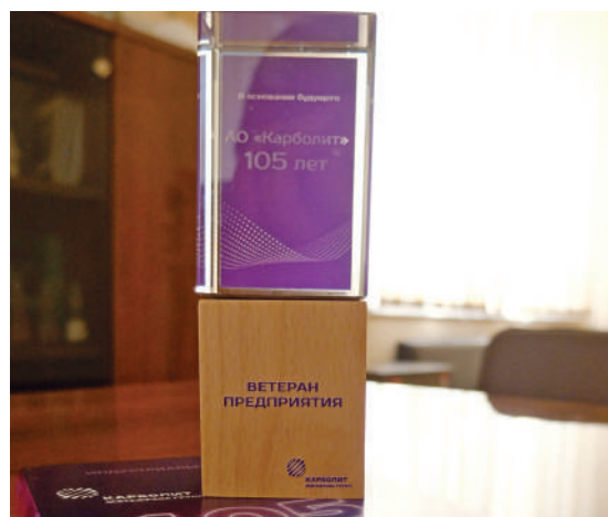
По случаю юбилея «Карболита» ветераны предприятия получили памятные знаки