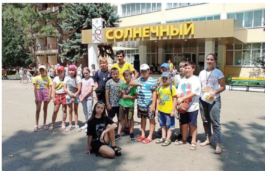
Губахинские мальчишки и девчонки на отдыхе в черноморском лагере «Жемчужина России»

ОЗДОРОВИТЕЛЬНАЯ ПРОГРАММА в лагерях им. Ю. А. Гагарина Министерства иностранных дел РФ и «Лесной» была очень насыщенной, ребята состязались в спортивных играх, пели, танцевали, занимались творчеством – скучать было просто некогда. А юные полиглоты, побывавшие в лагере ВКС+English с углубленным изучением английского языка, не только пополнили свой запас знаний, но и получили навыки конной езды.