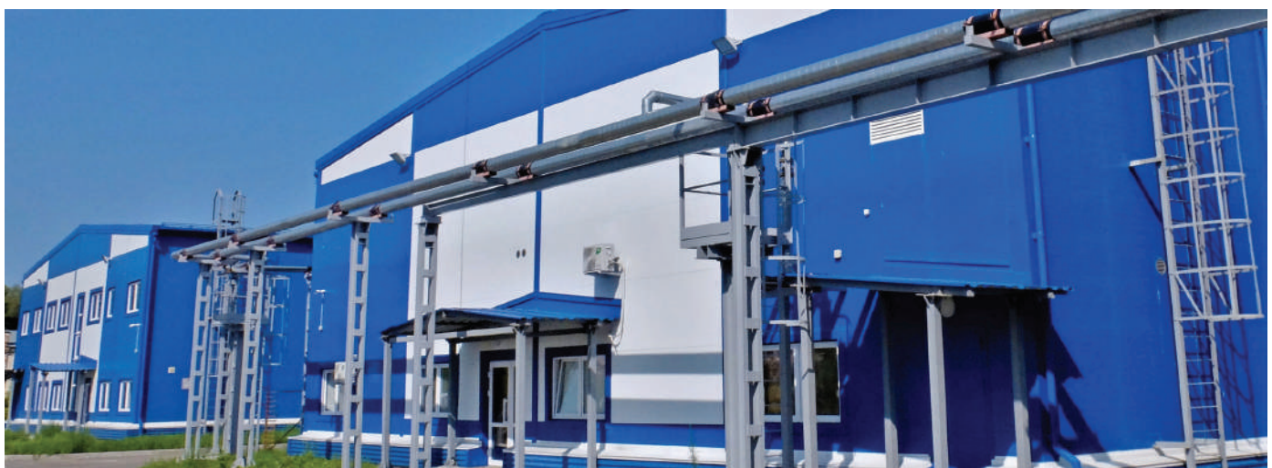
Новые цеха «Карболита»