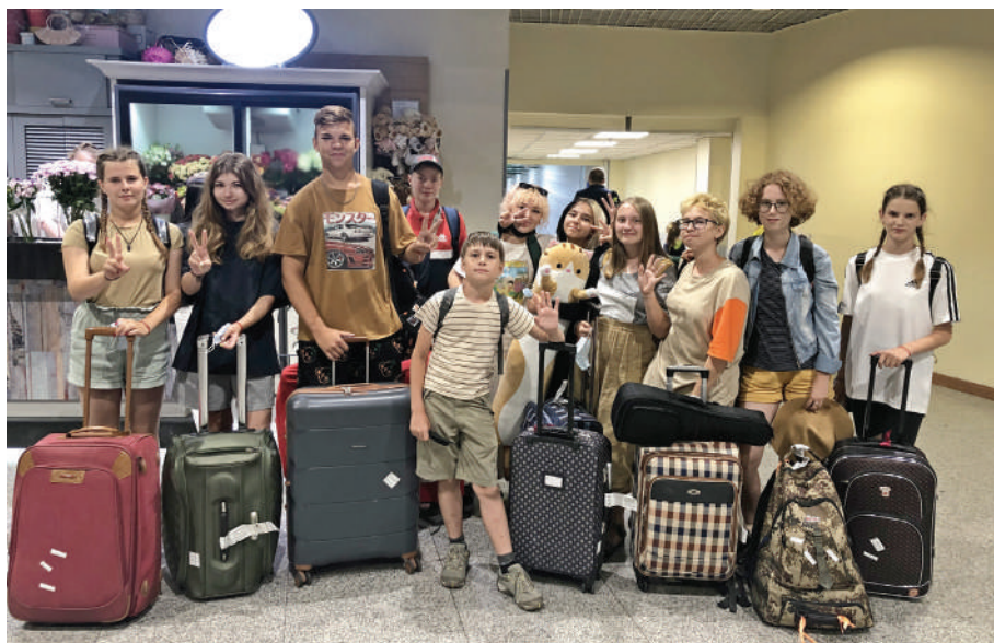
Детский отдых – приоритетное направление социальной политики «Метадинеа»

К слову, на детей, которые любят отдыхать с родителями, компания также