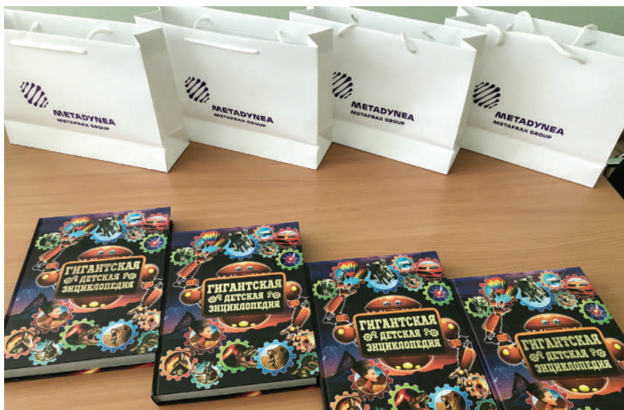
Красочные и увлекательные энциклопедии подготовили для своих первоклассников в компании «Метадинеа»

С подарками от «Метафракс Кемикалс» начался учебный год у первокурсников УХТК и учащихся новых технологических классов НОЦ, а также студентов, которые в этом году поступили в вузы по договору с компанией.