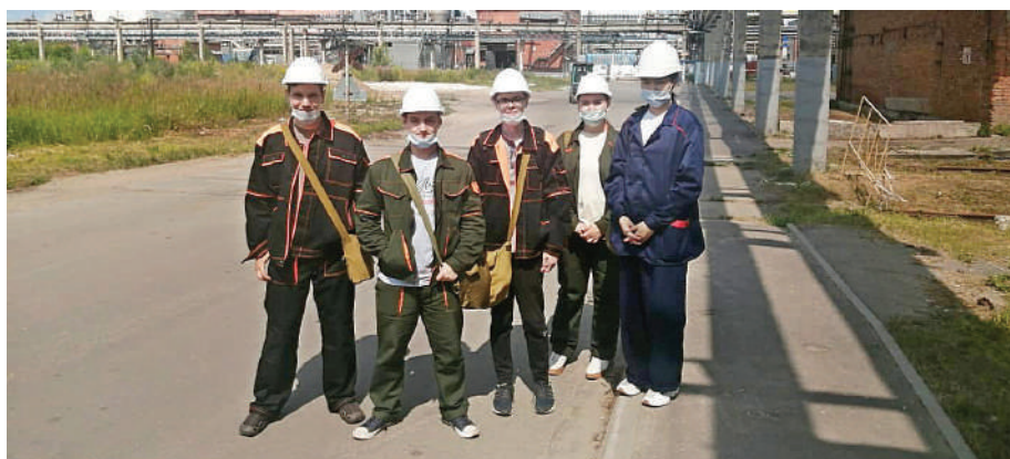
Студенты на практике в компании «Метадинеа» в Орехово-Зуеве