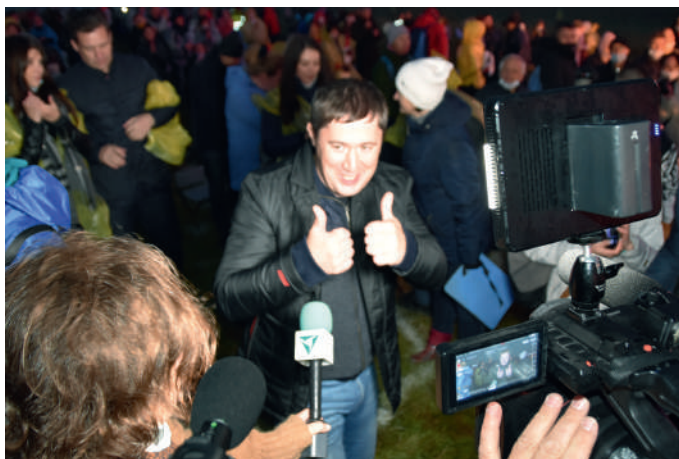
Почетным гостем фестиваля стал глава региона Дмитрий МАХОНИН