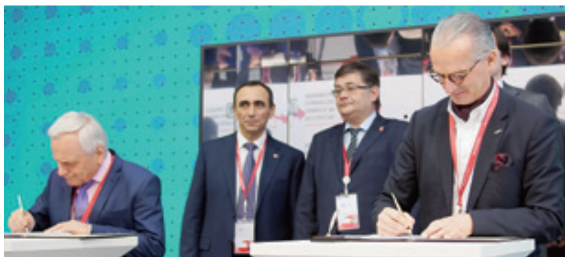
На Российском инвестиционном форуме в Сочи 14 февраля ПАО «Метафракс» и компания GEA подписали контракт на разработку проекта и поставку оборудования для возведения установки парформальдегида на производственной площадке в Губахе.