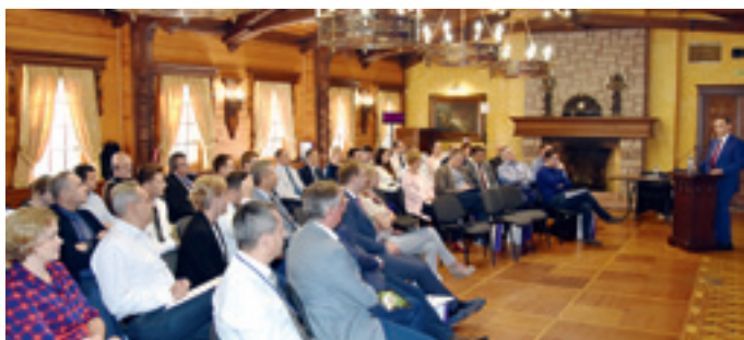
Вторая стратегическая сессия группы компаний MetaTeamEvent собрала первых руководителей и ведущих специалистов предприятий, входящих в ГК «Метафракс».