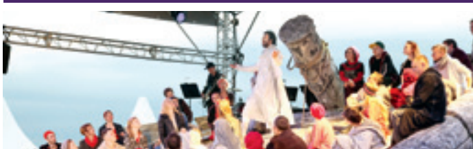
В Губахе рок-оперой «Иисус Христос – суперзвезда» в исполнении артистов пермского Театра-Театра открылся Восьмой театральный ландшафтный фестиваль «Тайны горы Крестовой».