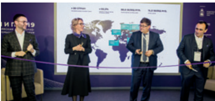
В рамках Пермского инженерно-промышленного форума состоялась презентация нового бренда группы компаний «Метафракс».