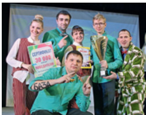
В традиционную игру КВН среди структурных подразделений «Метафракса» в апреле сыграли шесть сборных.