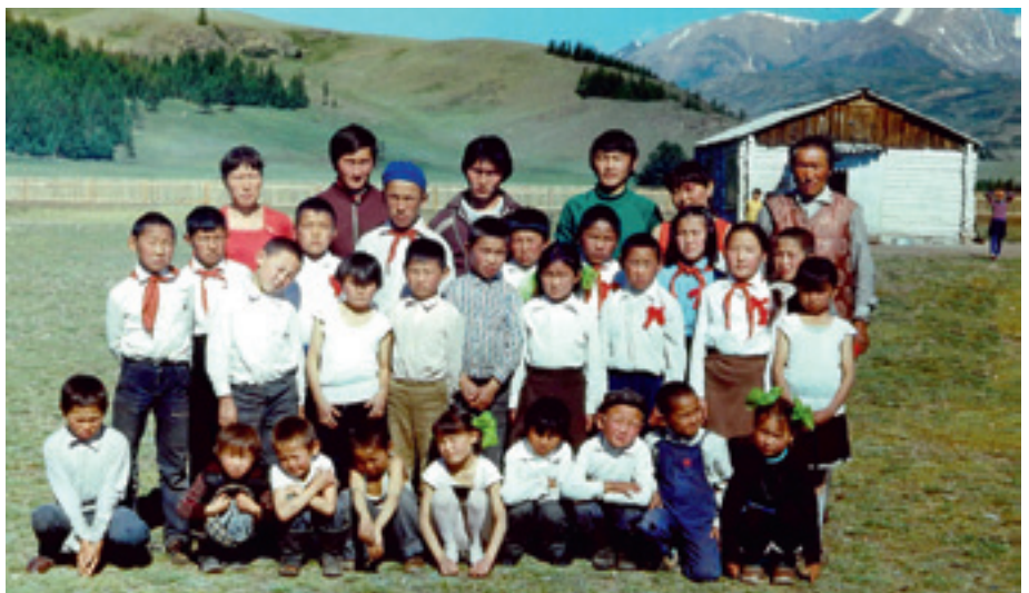
Юные пионеры тувинского лагеря «Мальчин».

Записала Ольга ВОТИНЦЕВА