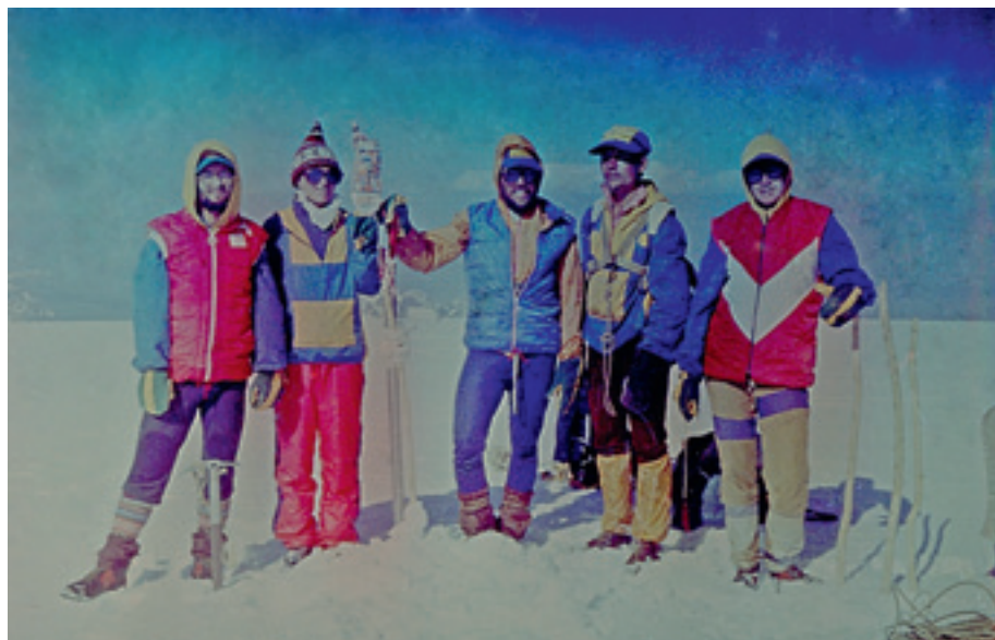
Группа туристов на вершине Монгун-Тайги.

Казалось, дождь, провожавший туристов еще в Губахе, добрался до Саян и не собирался их отпускать. Первую ночевку перед стартом провели под