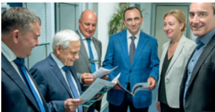
В конце июля в Лугано (Швейцария) состоялось открытие нового офиса компании «Метафракс Трейдинг».