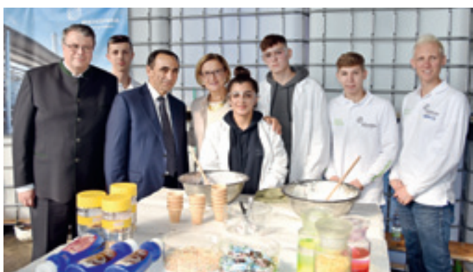
В Кремсе в индустриальном парке «Метадинеа» состоялся традиционный День открытых дверей, в рамках которого состоялся запуск новой высокотехнологической установки по производству карбоновых кислот и альдегидов.