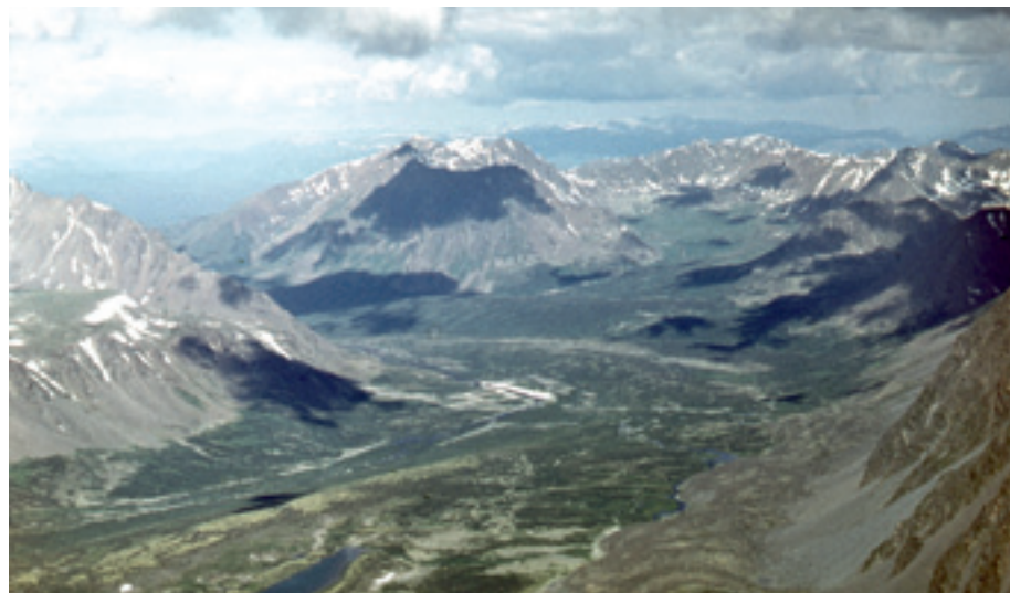
Вид на Алтай с вершины горы Ташкалы-Кая.

На пятый день похода в горах туристы встретились с местными жителями.