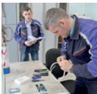
В компании состоялись конкурсы профмастерства, участниками которых стали более сотни работников предприятия различных профессий.