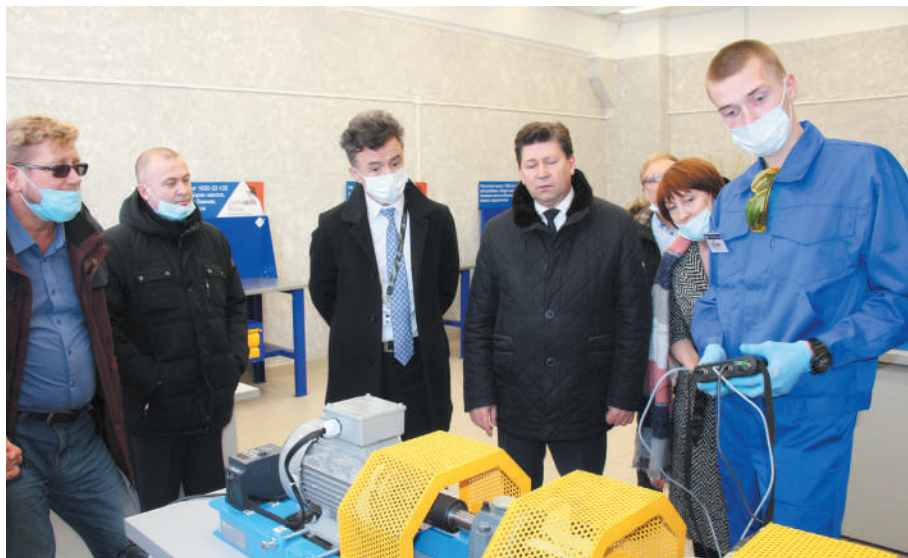
Презентация специализированного центра компетенций

СОВРЕМЕННЫЙ МНОГОФУНКЦИОНАЛЬНЫЙ СТАДИОН с футбольным полем и трибунами на 100 посадочных мест, зоной для занятий легкой атлетикой, универсальной игровой площадкой для баскетбола и волейбола, площадкой для занятий воркаутом будет