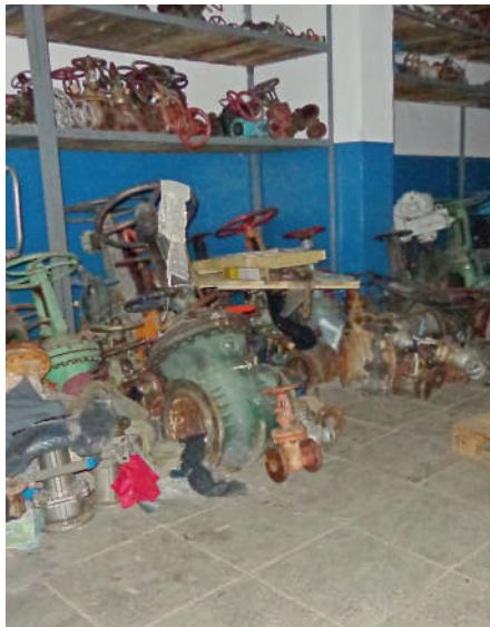
Было – стало: упорядоченные по типам и размерам задвижки значительно упростят работу слесаря

«Мы начали получать обратную связь от работников цеха, что говорит об их