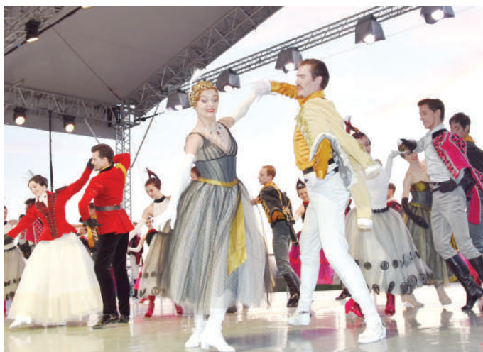
На фестивале состоялась премьера «Польского бала» – второго акта оперы «Жизнь за царя»