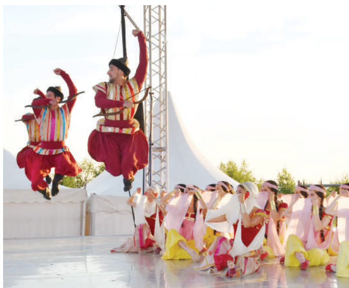
Артисты мастерски исполнили «Половецкие пляски» – хореографический отрывок из оперы «Князь Игорь»