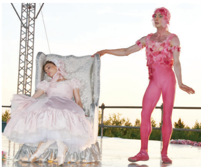
«Видение Розы» – балет о заснувшей после бала девушке, впервые поставленный «Русским балетом» Сергея Дягилева