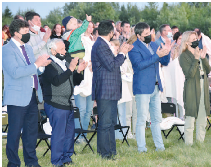
Почетным гостем фестиваля стал губернатор края Дмитрий МАХОНИН