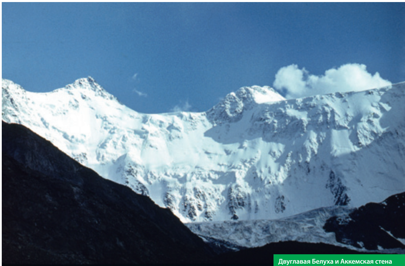
Двуглавая Белуха и Аккемская стена

Дневник читала Ольга ВОТИНЦЕВА