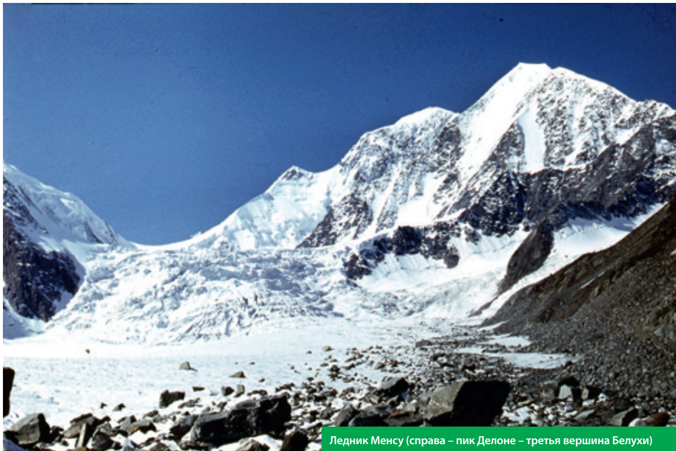
Ледник Менсу (справа – пик Делоне – третья вершина Белухи)