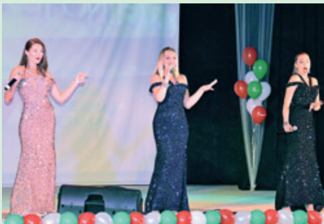
С праздником строителей поздравили солистки вокального проекта «Экспромт»