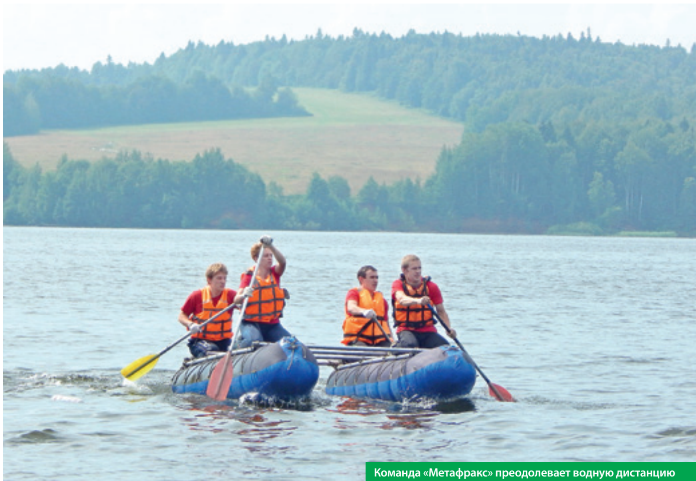
Команда «Метафракс» преодолевает водную дистанцию