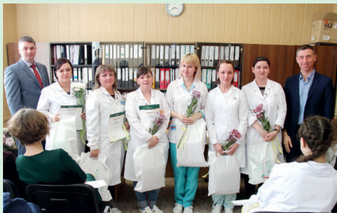
Участники и организаторы конкурса лаборантов чествуют своих лидеров