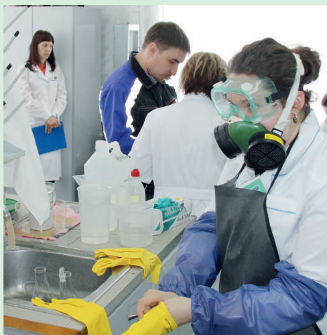
Идет выполнение конкурсного задания