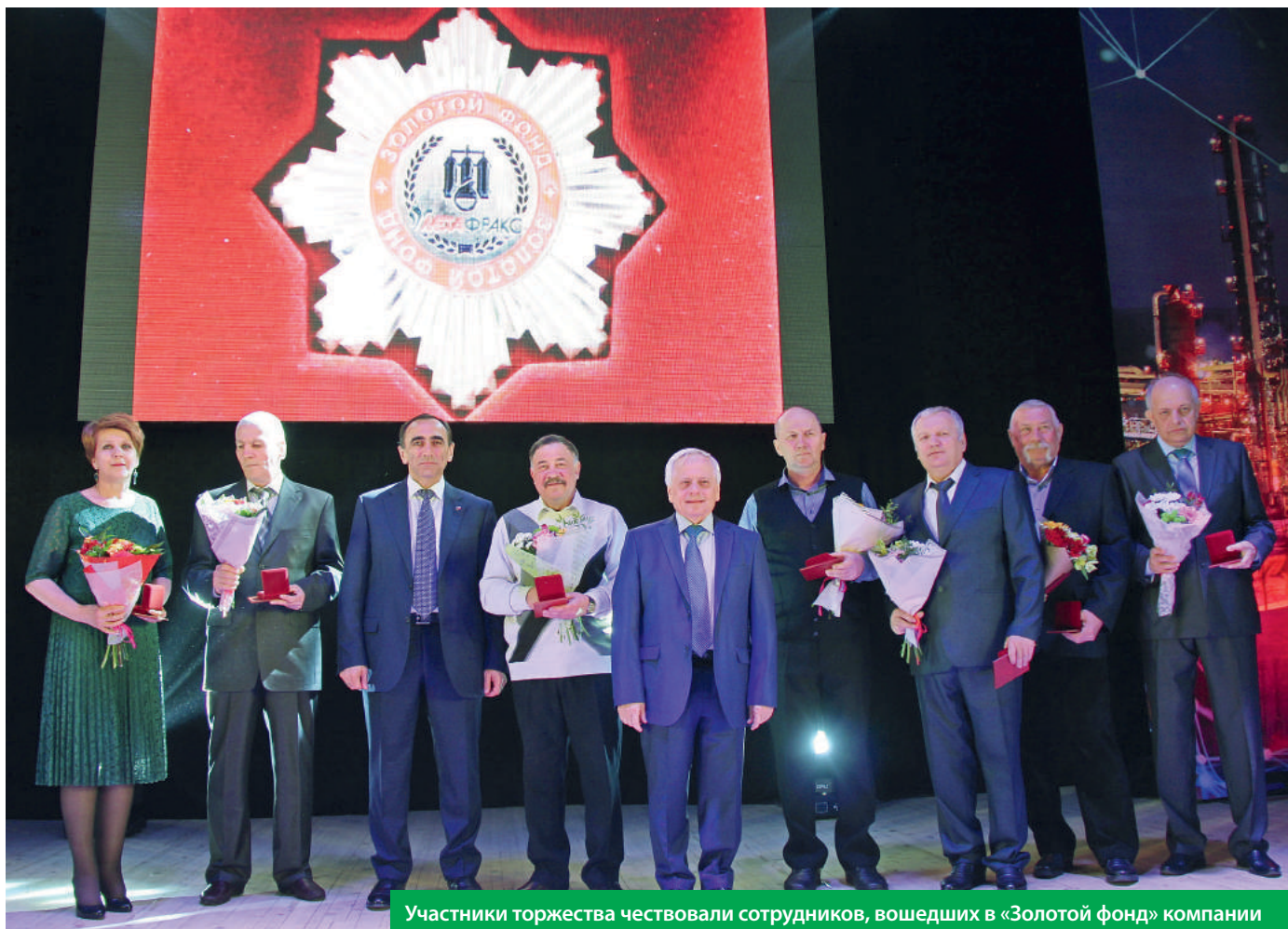
Участники торжества чествовали сотрудников, вошедших в «Золотой фонд» компании