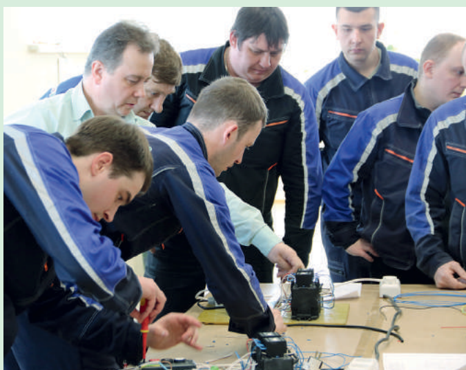
Идет процесс выполнения практического задания № 2 по сборке схемы реверсивного пускателя