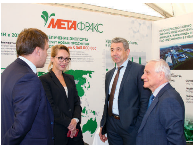
Экспозиция ПАО «Метафракс» в павильоне компании «Сибур-Химпром» вызвала интерес ведущих сотрудников химических предприятий региона

Высоко оценив вклад химических предприятий края в экономику страны, Дмитрий Козак поручил профильным министерствам и ведомствам