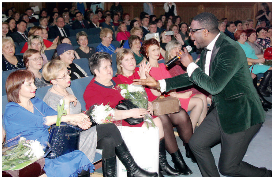
Сотрудниц компании поздравили проникновенными песнями солисты группы «Лазурный берег»