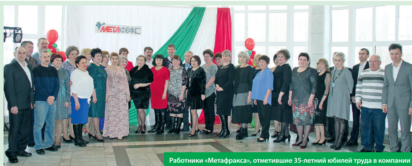
Работники «Метафракса», отметившие 35-летний юбилей труда в компании