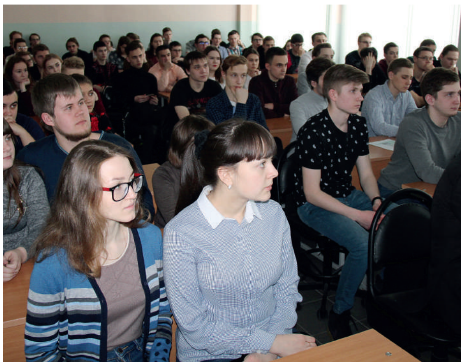
Лекционная аудитория была полностью заполнена студентами, пришедшими на встречу с руководителем «Метафракса»

СЕГОДНЯ на химико-технологическом факультете Пермского НИПУ обучаются по договору с ПАО «Метафракс» 100 студентов из разных городов Пермского края. Будущие работники изучают химические технологии, автоматизацию технологических процессов, производственные машины и аппараты. В УХТК за счет «Метафракса» осваивают химическую технологию 16 учащихся (внебюджетная группа).