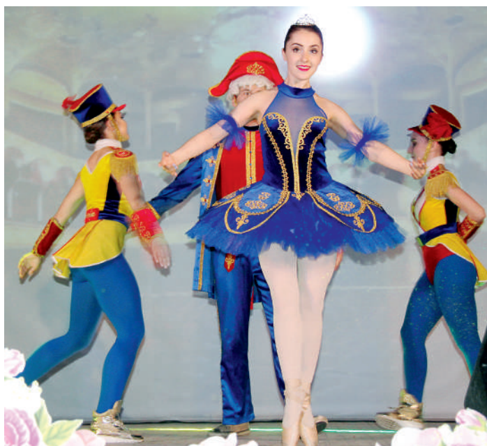
Яркое выступление артистов театра танцевальных миниатюр Hi-Tech

NOUS AIMONS PARIS (франц.) – Мы любим Париж