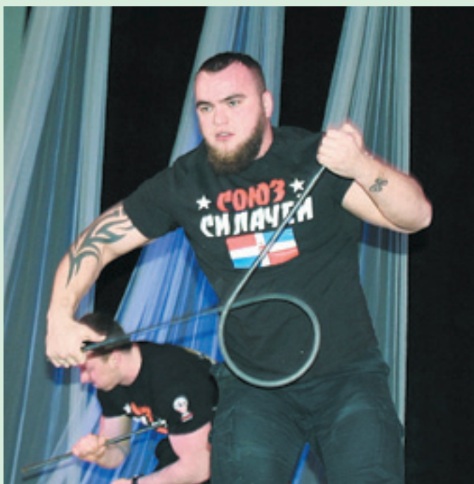
Настоящее мужское шоу «Русская сила»