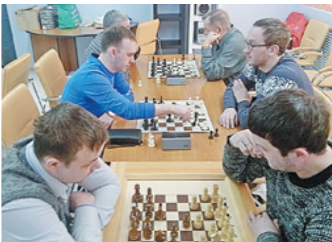
За десять минут матча участники успевали продумать сотни шахматных комбинаций