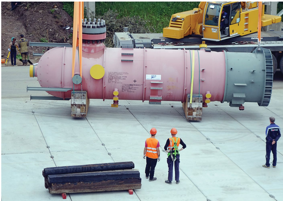
Все оборудование, поступающее на строительную площадку АКМ, а также его доставка, хранение и монтаж защищены страховыми гарантиями