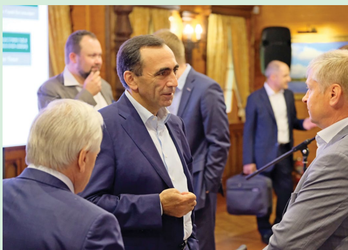
Два рабочих дня, отведенных на стратегическую сессию, прошли в общении коллег и в разработке уточненных планов