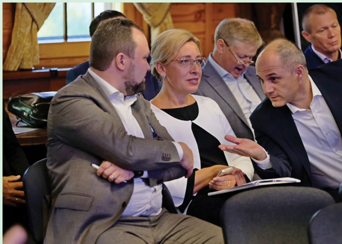
У коллег в ходе сессии рождались в дискуссиях интересные предложения о повышении эффективности основной деятельности