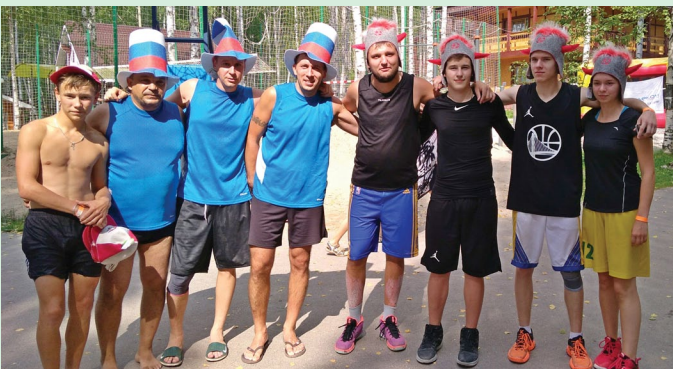
Программа дня также была насыщена спортивными состязаниями по стритболу, футболу, пляжному волейболу, дартсу. Активными участниками соревнований стали представители мужского пола