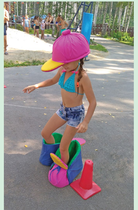
Малыши с удовольствием примеряли на себя необычные костюмы и пускались в погоню за победой