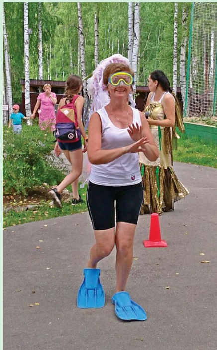
Перед купанием ведущие на суше проверяли у всех участников праздника их плавательные способности