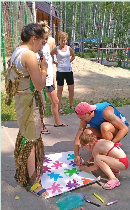
Девчонки и мальчишки вместе с родителями показали не только силу, ловкость и прыгучесть, но и творческие таланты