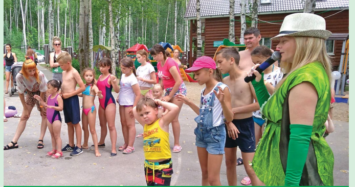
Самыми энергичными и веселыми участниками праздника оказались дети