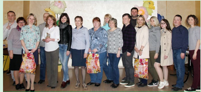
Памятное фото членов трёх команд-победительниц интеллектуального турнира: «Профессионалы», «Девчата и они» и «Незнайки»

– Этот турнир оказался по степени сложности труднее предыдущих, – призналась