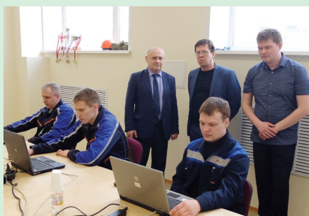
Участники первенства выполняют конкурсное теоретическое задание