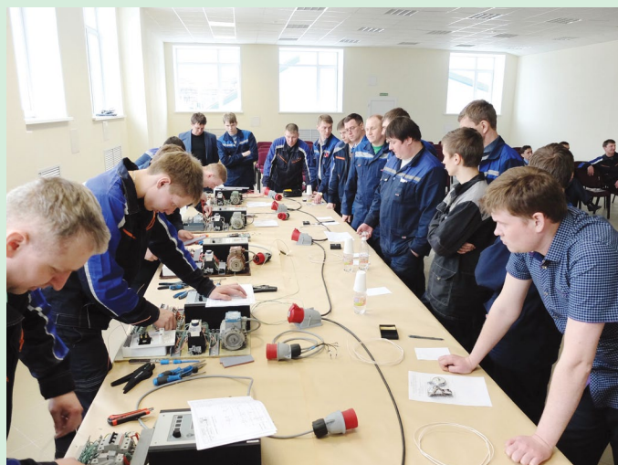
Конкурсанты выполняют задание – сборку схемы частотного управления электродвигателя