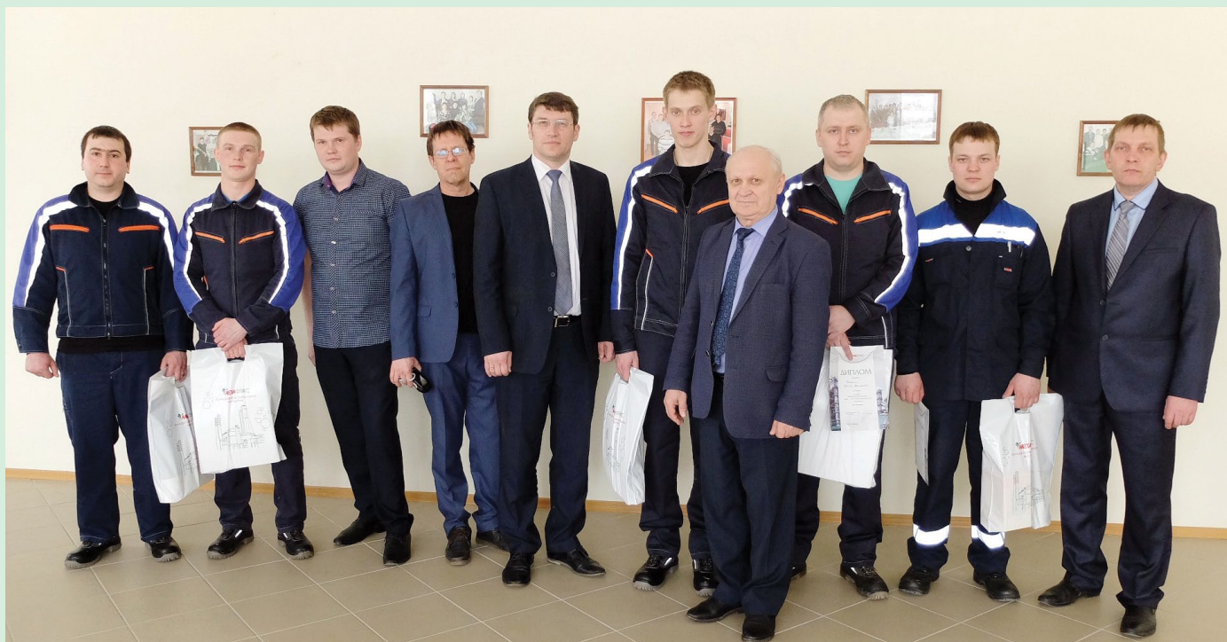
Итоги первенства среди электриков подведены. Несмотря на небольшую разницу завоёванных баллов, все пятеро претендентов являются квалифицированными работниками и получили награды за волю к победе