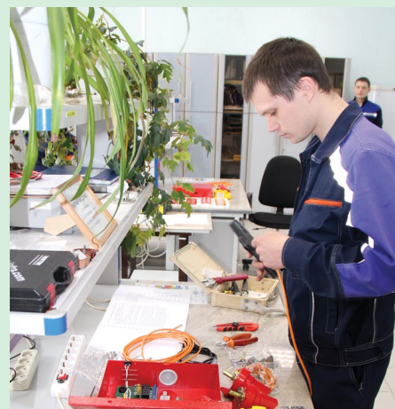
Конкурсанту – слесарю КИПиА предстояло сконфигурировать измерительную головку для электрохимических сенсоров на пары формальдегида и откалибровать её поверочной газовой смесью