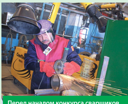
Перед началом конкурса сварщиков, состоящего из двух частей – теоретической и практической, участники разыграли рабочие места (кабинки) и очерёдность выполнения частей турнира