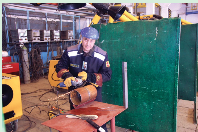
В практической части конкурса участники производили сварку контрольного стыка в точном соответствии с технологической картой двух катушек труб в неповоротном положении