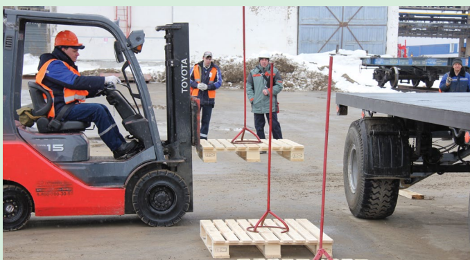
В ходе выполнения конкурсного задания водителю нужно было максимально бережно выполнить погрузку, да так, чтобы не уронить металлическую стойку