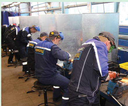
Конкурсное задание по сложности соответствовало квалификации слесарей-ремонтников, но потребовало от них особого внимания и профессионализма