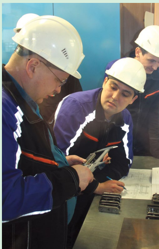
Члены судейской бригады первенства слесарей ПОРОТЦ скрупулёзно оценивали результаты выполнения конкурсных заданий