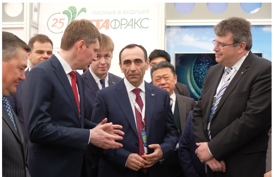
На площадку «Метафракса» и «Метадинеа» прибыли высокие гости во главе с губернатором края Максимом РЕШЕТНИКОВЫМ

поставят корейцам первые 200 тонн продукции через трейдинговую компанию в Сеуле.