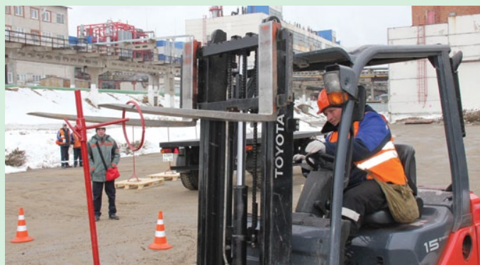
Безошибочное снятие и одевание кольца, висящего на стойке, – удел асов в профессии водителей автопогрузчиков