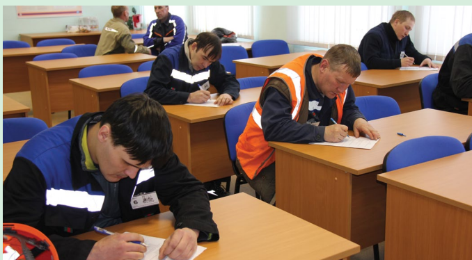
Теоретическая подготовка – важная составляющая профессионализма конкурсантов. Претенденты показали высокие знания в области безопасности проведения погрузочно-разгрузочных работ