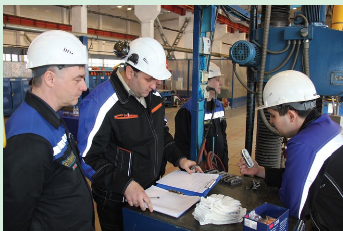
Подавляющее большинство из десяти претендентов в первенстве слесарей-ремонтников успешно справились с конкурсным заданием