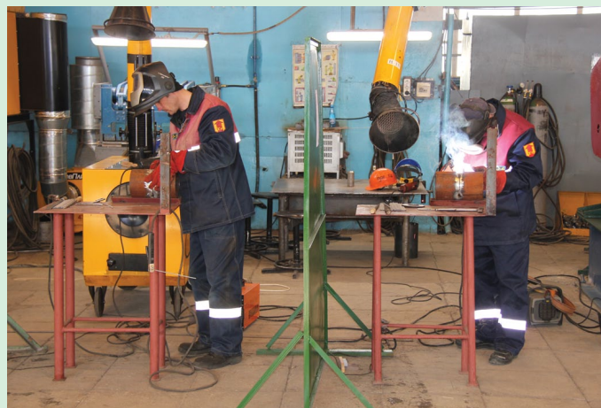
Конкурсантам разрешалось пользоваться всеми видами инструментов для точного следования технологии сварки