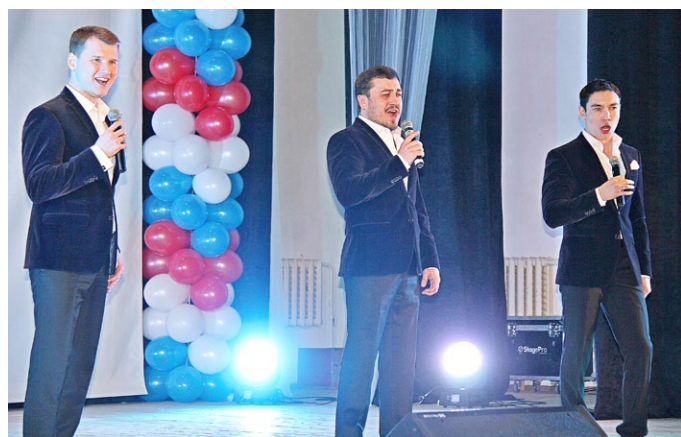
«Сильное» выступление вокальной группы «Премьер»