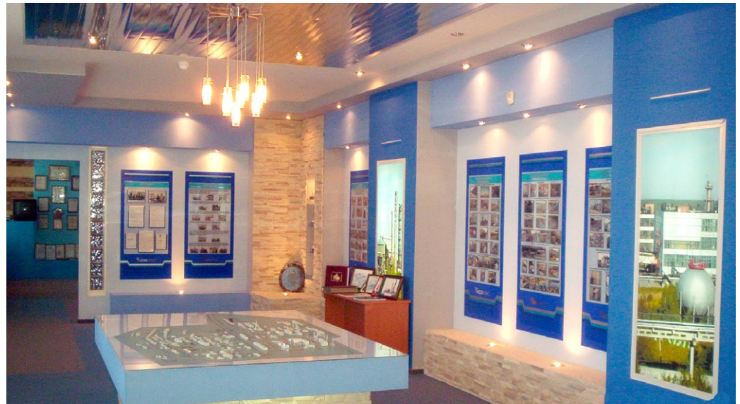
А таким был корпоративный музей компании раньше

Частыми гостями музея предприятия стали школьники, учащиеся колледжей, техникумов и студенты вузов из Пер-