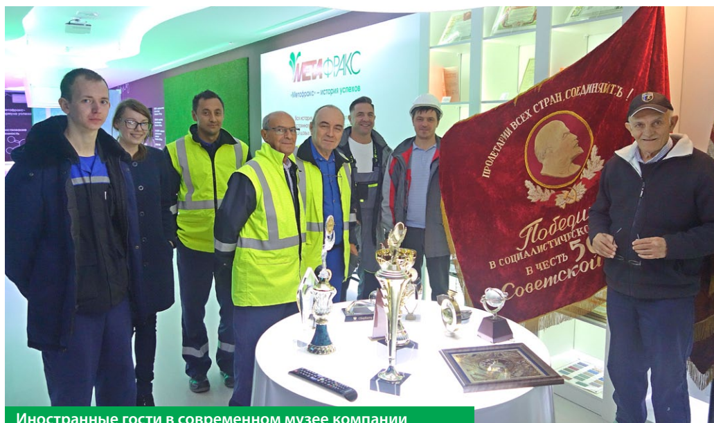
Иностранные гости в современном музее компании