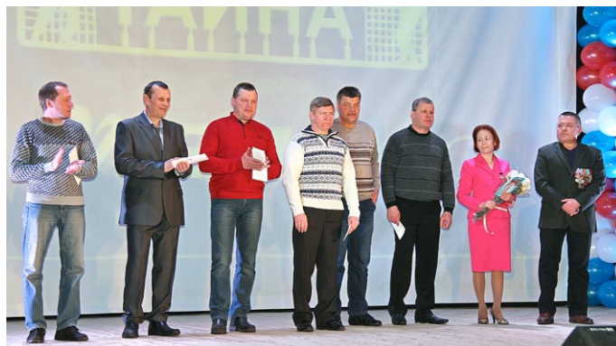
Чествование воинов компании, участвовавших в боевых действиях в Афганистане

СОТРУДНИКИ КОМПАНИИ - УЧАСТНИКИ ЛОКАЛЬНЫХ ВОЙН благодарят руководство предприятия за внимание, заботу и прекрасный праздничный вечер.