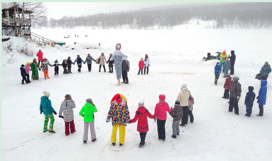
Дружно и весело проводили зиму участники масленичных гуляний на базе отдыха «Уральский букет»