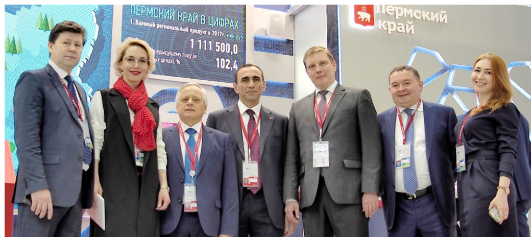
Представители компании «Метафракс» возле стенда Пермского края.

НА ПЛОЩАДКЕ АКМ в эти дни завершается прокладка подземных коммуникаций. С началом весенне-летнего периода строители приступят к укладке фундаментов под металлоконструкции зданий, в которых будет монтироваться оборудование.