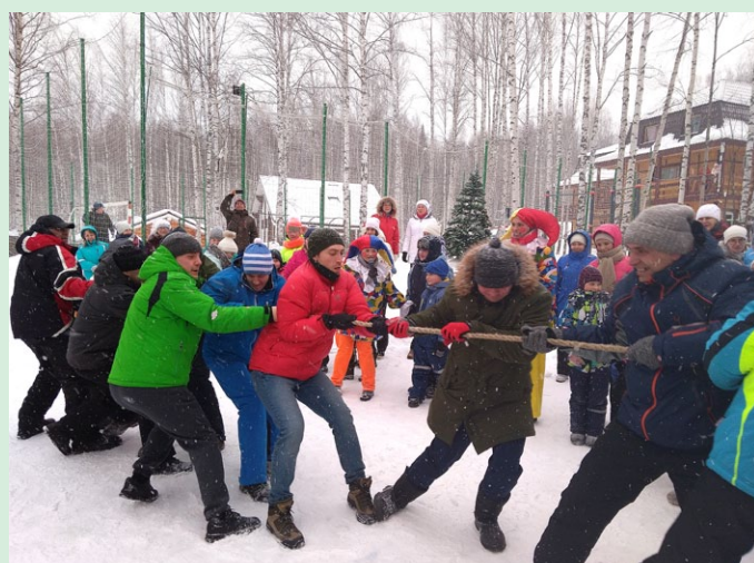
Блинами, играми, забавами и спортивными состязаниями была богата масленичная программа