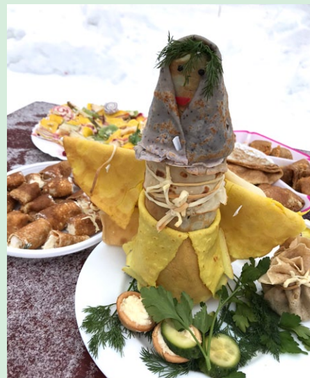
Такие кулинарные шедевры приготовили участники на блинный конкурс