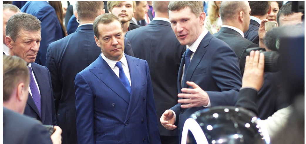
Стенд Пермского края посетили федеральные министры и руководители финансовых структур во главе с премьер-министром Дмитрием МЕДВЕДЕВЫМ