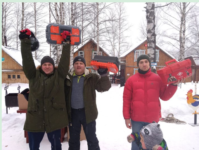
Губахинские богатыри получили заслуженные награды