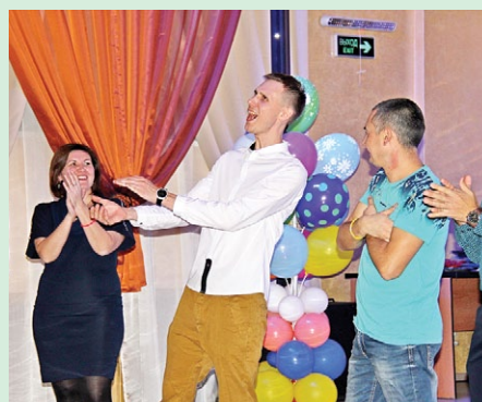
День рождения выдался увлекательным, дружным и ярким на эмоции