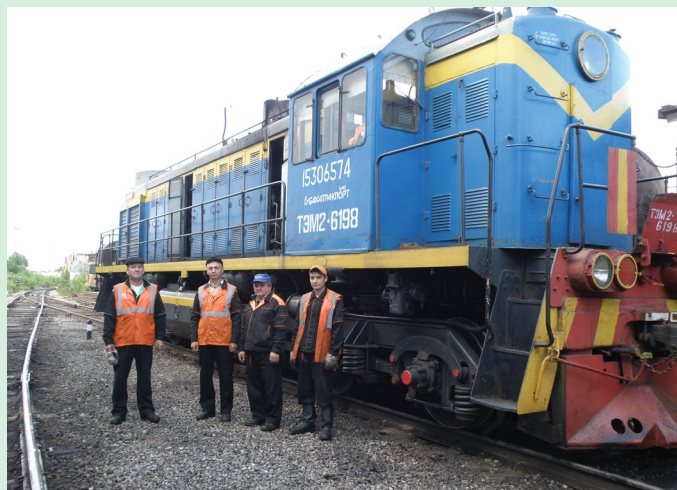
В состав группы компаний «Метафракс» вошло АО «Губаха-транспорт»