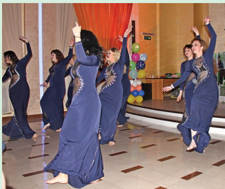
Заворожили гостей чарующей энергетикой востока красавицы танцевального коллектива «Абаль»