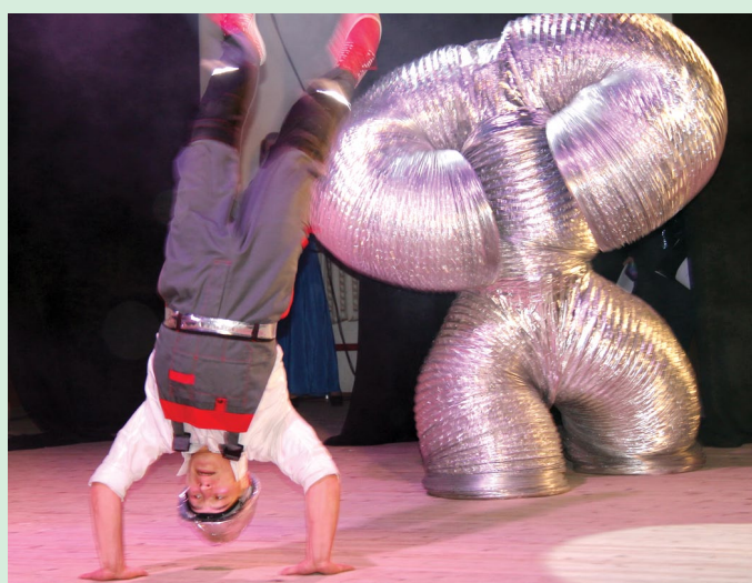
Зрители аплодировали мастерской постановке «Сантехник и шеф» в исполнении хореографической группы