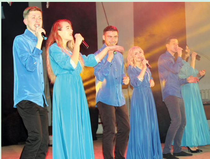
Зрители подолгу не отпускали со сцены солистов шоу-хора «Ирония» за трогательное исполнение современных и уже вошедших в классику песен