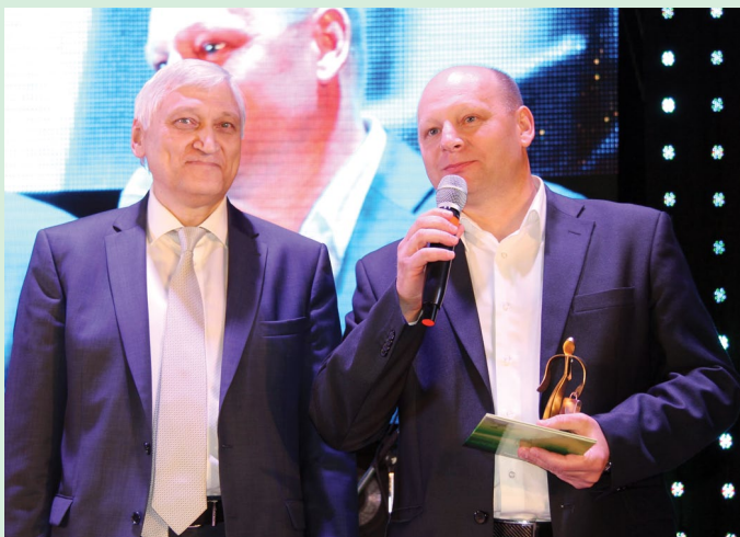
На «Метафраксе» названы 10 обладателей корпоративной премии «Человек года»