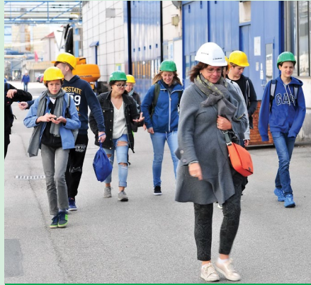
В компании «Метадинеа-Австрия» прошел День открытых дверей. Более тысячи гостей побывали на предприятии и познакомились с его деятельностью