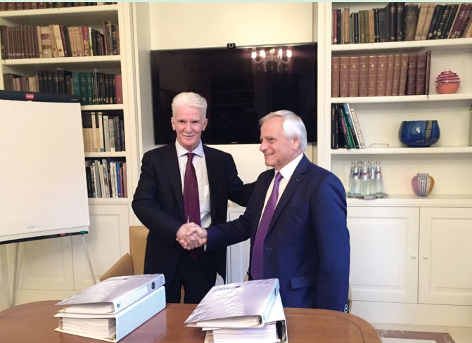
Компания «Метафракс» подписала контракт с ведущим разработчиком технологий в производстве синтез-газа и удобрений Casale на инжиниринг, поставку оборудования и управление строительством масштабного комплекса «Аммиак-карбамид-меламин» (АКМ) в Губахе