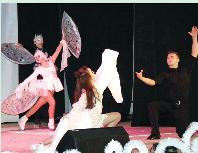
Удивительные хореографические зарисовки заметно украшали концерт артистов – гостей города