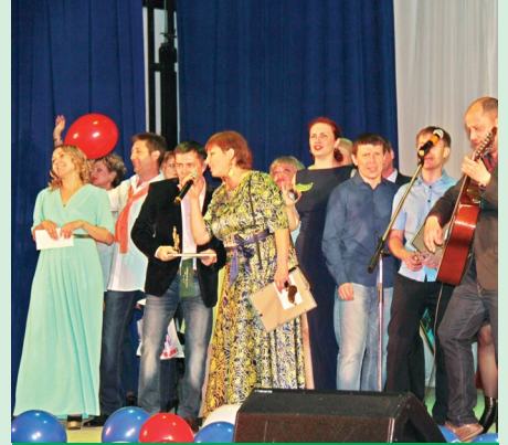
В Губахе прошел краевой смотр-конкурс художественной самодеятельности работников химической отрасли Прикамья «Новые имена», посвященный 70-летию Росхимпрофсоюза