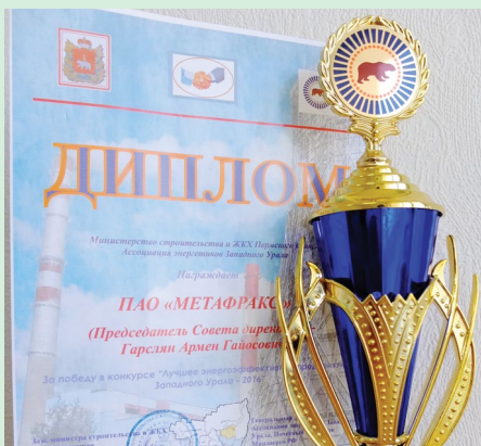
«Метафракс» назван лучшим энергоэффективным предприятием Западного Урала