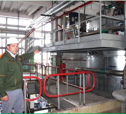
На подмосковной «Метадинее» завершили монтаж реактора R-1500, что позволит увеличить производственные мощности смольной площадки