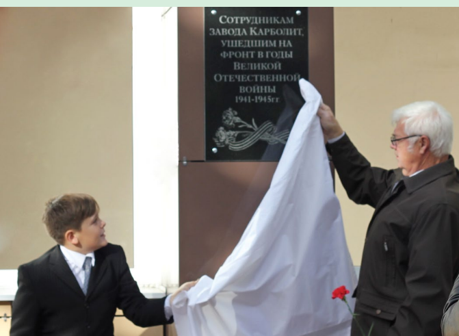
В АО «Карболит» торжественно открыли мемориальную доску, посвященную сотрудникам завода, ушедшим на фронт в годы Великой Отечественной войны 1941-1945 гг.