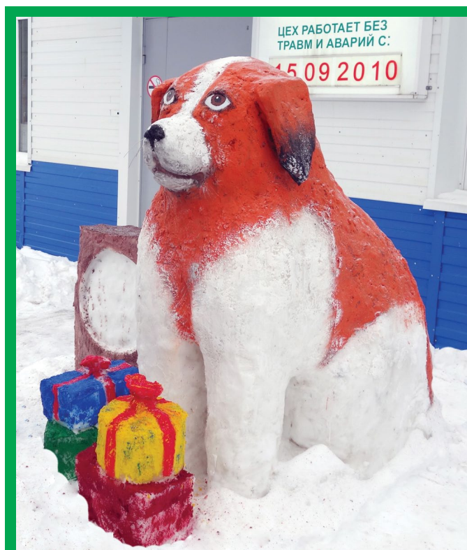
Такой снежный символ наступающего года – Жёлтая Собака – поселился на «Метафраксе» у цеха по обслуживанию и ремонту автоматизированных систем управления (ЦОРАСУ).