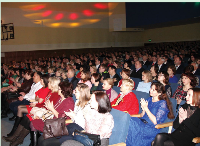
Зрители аплодисментами встречали выступления артистов и даже подпевали солистам шоу-хора «Ирония»