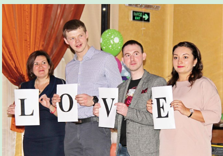
С интересом и любовью приняли участие во всех конкурсах гости праздника