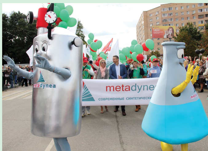
Подмосковная «Метадинея» приняла участие в праздновании столетия Орехово-Зуева, пройдя в праздничном шествии по улицам города