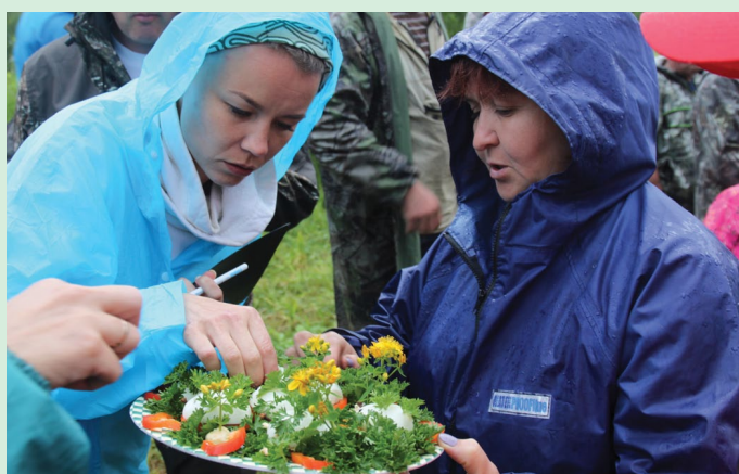
В конкурсе «Блюдо» свой кулинарный шедевр представляет команда «Гринпис». Стоит отметить, что практически все сборные в этом конкурсе ограничились холодными закусками, единственным «горячим» исключением оказался рулет «Полено» в исполнении команды «Понаехали». При этом условием конкурса было определено наличие в блюде обязательных ингредиентов – яйца и сыра