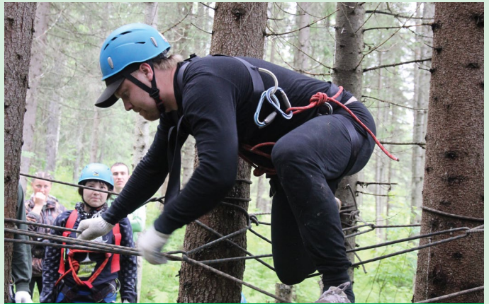
На «маршруте выживания» традиционно командам нужно было показать навыки скалолазания, умение вязать узлы, знание медицины. Сложной для многих команд на этот раз стала викторина, судьи приготовили массу каверзных вопросов по географии Пермского края и на другие темы. Ну а физически отдохнуть, но в то же время эмоционально взбодриться участникам помогла «художка»