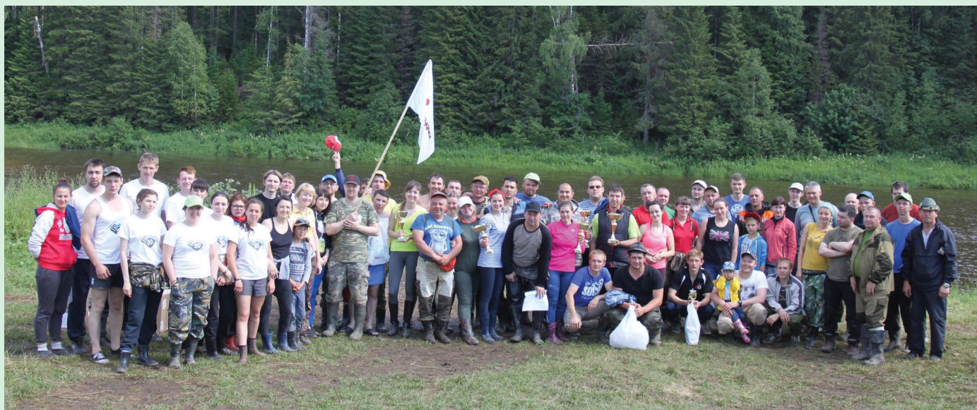
Юбилейный X туристический слет ПАО «Метафракс» на лоне великолепной шумихинской природы на берегу Усьвы на три дня сплотил пять команд из различных структурных подразделений компании