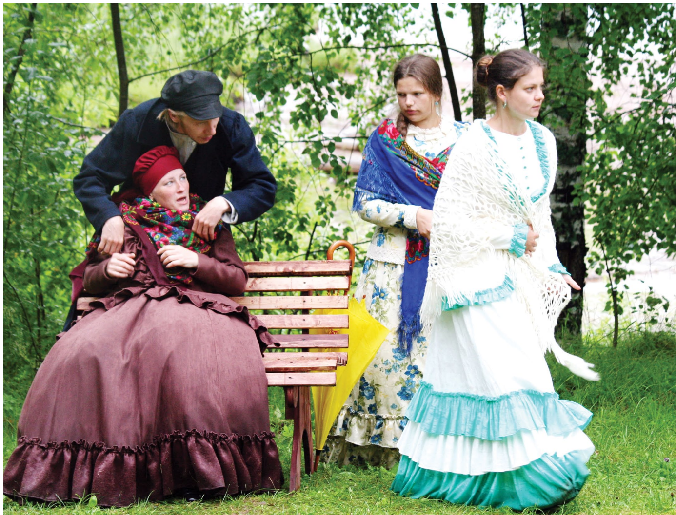
В семье Кабановых царил нервная обстановка