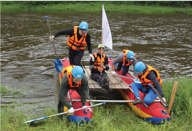
Водную переправу успешно преодолевает команда производства метанола. В этом году судьи приготовили для команд непростую полосу препятствий – помимо водного этапа участникам предстояло преодолеть «паутину», «ромб», навесное бревно и сделать это не только качественно (чтобы избежать штрафных баллов), но и быстро