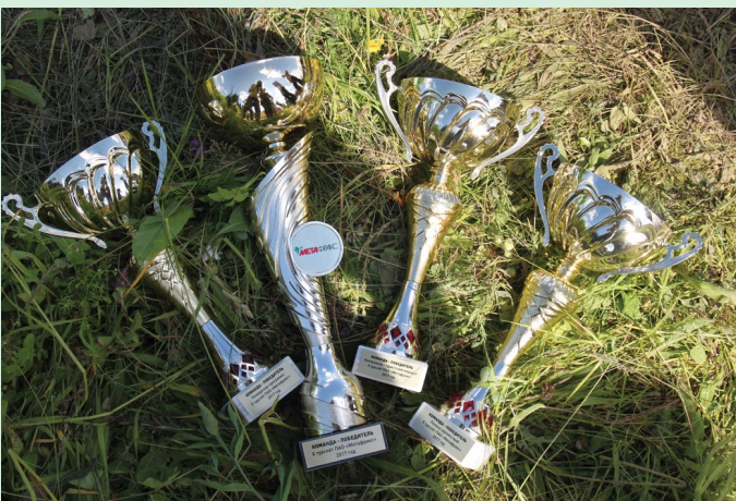
По результатам общего зачета туристического слета «Метафракс-2017» кубок за первое место взяла сборная «Привала.нет». На втором месте расположилась команда «Понаехали», третья ступень почетного туристического пьедестала досталась команде «Метанол»