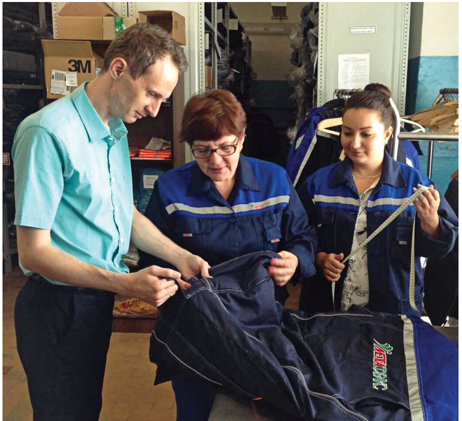
Комиссия ведет строгий контроль соответствия спецодежды необходимым ГОСТам и нормам

СТОИТЬ ОТМЕТИТЬ, ЧТО ГОСТЫ на рабочую или так называемую спецодежду отличаются от стандартов на одежду фирменную, что зачастую вызывает у работников сомнения в соответствии выбранному размеру. Как правило, специ-