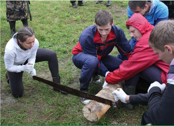
Конкурс «Распилка бревна» отнял у участников немало сил и вызвал бурю эмоций. Как ни старалась сборная «Пульты управления» (на фото), но все же не смогла опередить лучших пильщиков из команды «Привала.нет», справившихся с этим заданием всего за 49 секунд