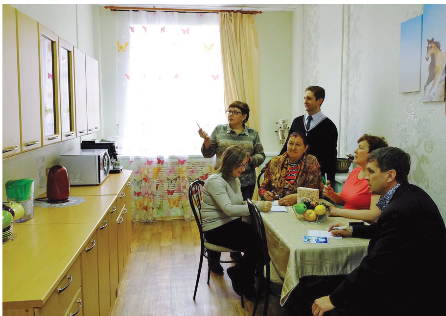
Члены конкурсной комиссии высоко оценили комфорт и уют комнаты приема пищи в цехе подготовки производства

Побывав на других родственных предприятиях региона, комиссия решила отметить в том числе и наш цех подготовки произ-