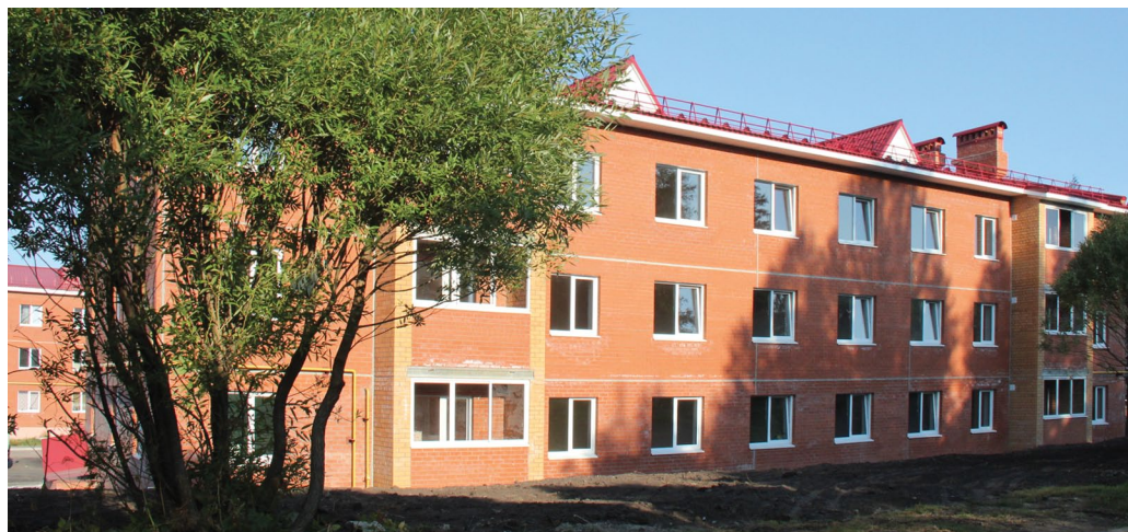
За три года строители «МетаТрансСтроя» возвели в Губахе два дома для сотрудников компании «Метафракс»

Кровли зданий и корпусов предприятия тоже находятся под пристальным вниманием строителей. На этот летний се-