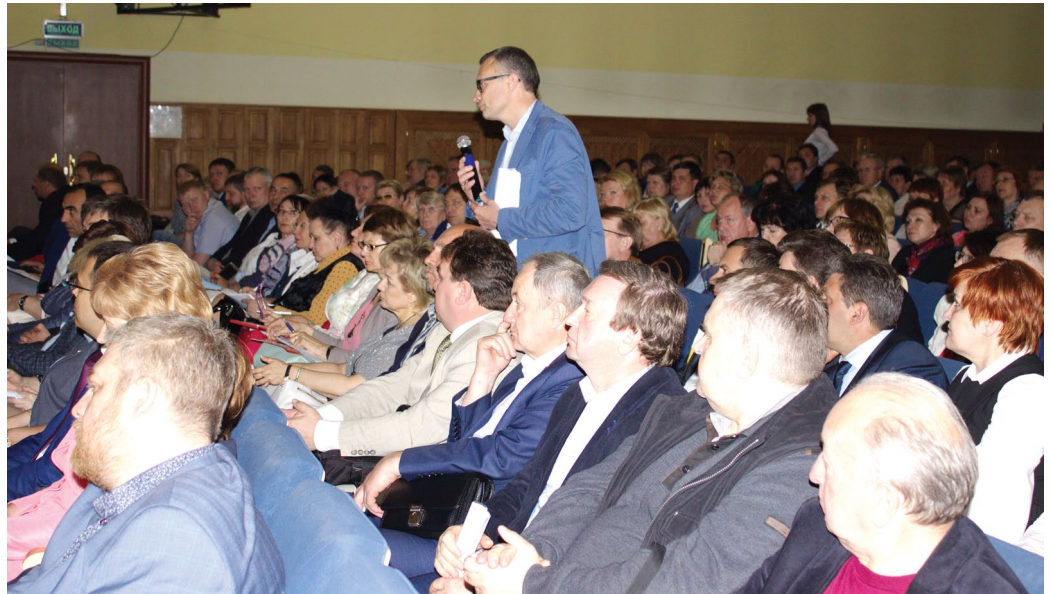
В Губахе состоялась расширенная коллегия краевого минздрава с участием властей и организаторов медобслуживания

Предстоит настойчиво внедрять телемедицинские технологии, в том числе и в ФАП, создать единую параклиническую службу и централизованную лабораторию, общее обеспечение ФАП медикаментами, единую диспетчеризацию скорой медпомощи и увеличить количество бригад для оказания неотложной помощи. Необходимо привлекать кадры и обеспечивать им достойные усло-