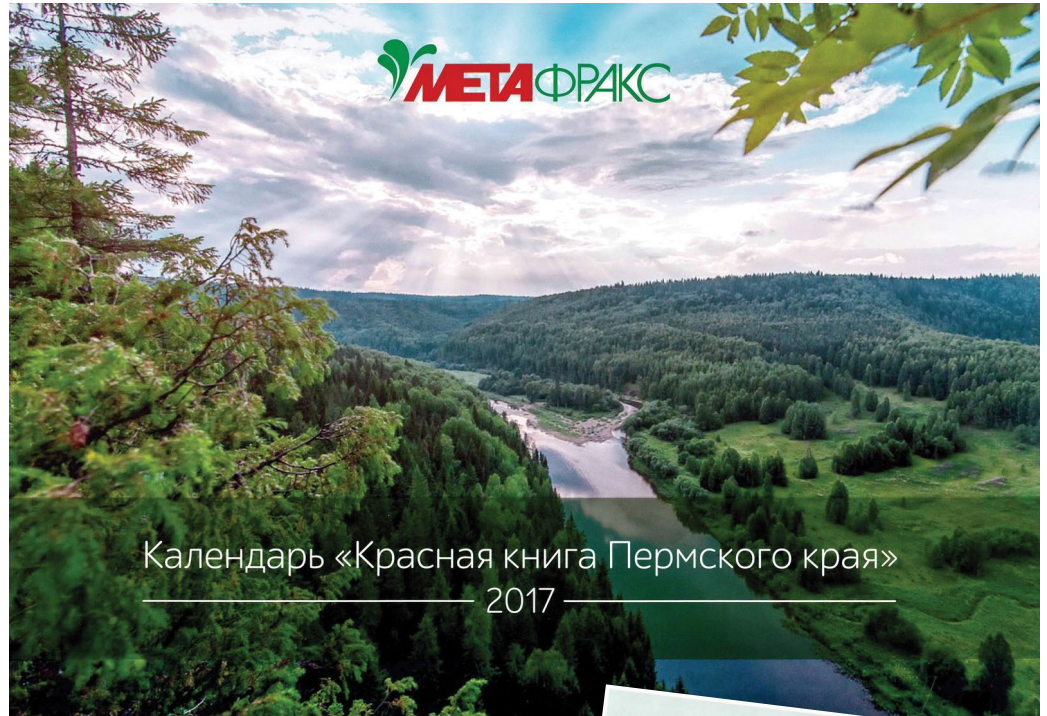
Календарь «Красная книга Пермского края» — 2017

В этом году география конкурса стала еще шире – в нее вош-