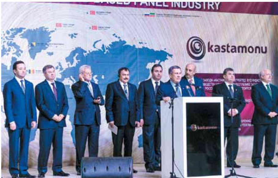
На открытии завода в Елабуге

Турецкая компания «Kastamonu» впервые открыла на территории ОЭЗ «Алабуга» крупнейшее в Европе предприятие. Объем инвестиций в новаторский проект превысил 600 млн долл. США.