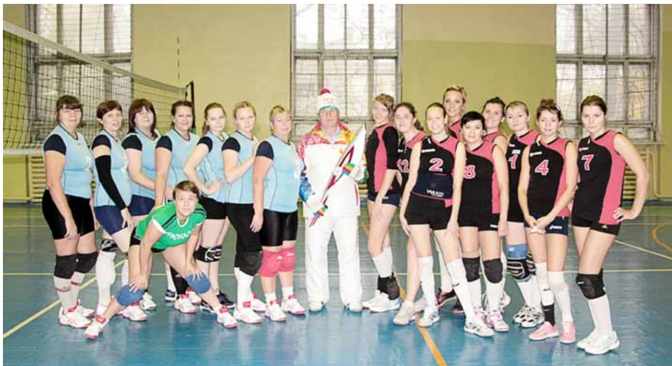
Женские волейбольные сборные «Метафракс» и «Уралкалий» с судьей соревнований