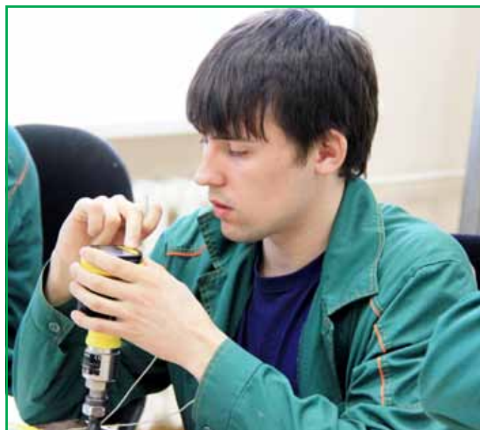
В семи конкурсах профессионального мастерства приняли участие порядка 80 специалистов «Метафракса» и 17 студентов УХТК.

ПОЛОЖИТЕЛЬНАЯ ДИНАМИКА омоложения коллектива сохранялась на протяжении всего полугодия. Средний возраст на предприятии равен 41 году. Если же посмотреть в разрезе возрастных групп, то пятую часть сотрудников предприятия составляет молодежь до 30 лет, чуть более 20% работников – от 30 до 40 лет, практически треть коллектива – в возрасте от 40 до 50, и еще одна треть – старше 50 лет.