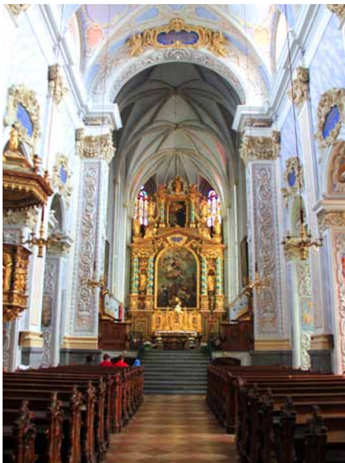
Монастырская церковь, воздвигнутая на романском фундаменте, расположена точно в центре барочного комплекса