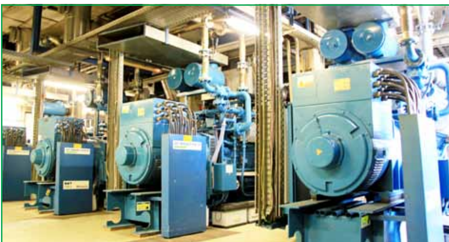
На собственной установке предприятие вырабатывает электроэнергию из «отходящего газа» при производстве формальдегида