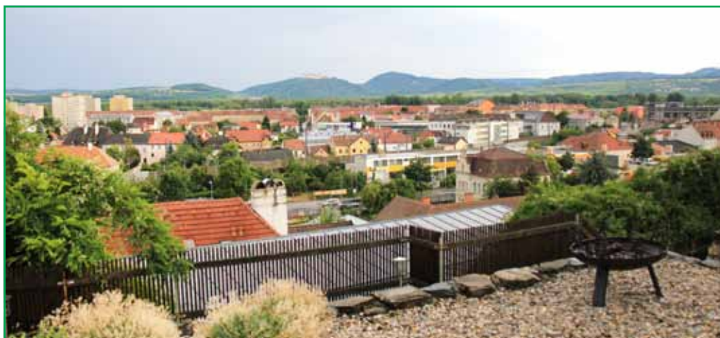
Геттвайг виден практически из любой точки австрийского Кремса

в Геттвайге в австрийском Кремсе сродни «Тайнам горы Крестовой» и «Балету на закате» в Губахе.