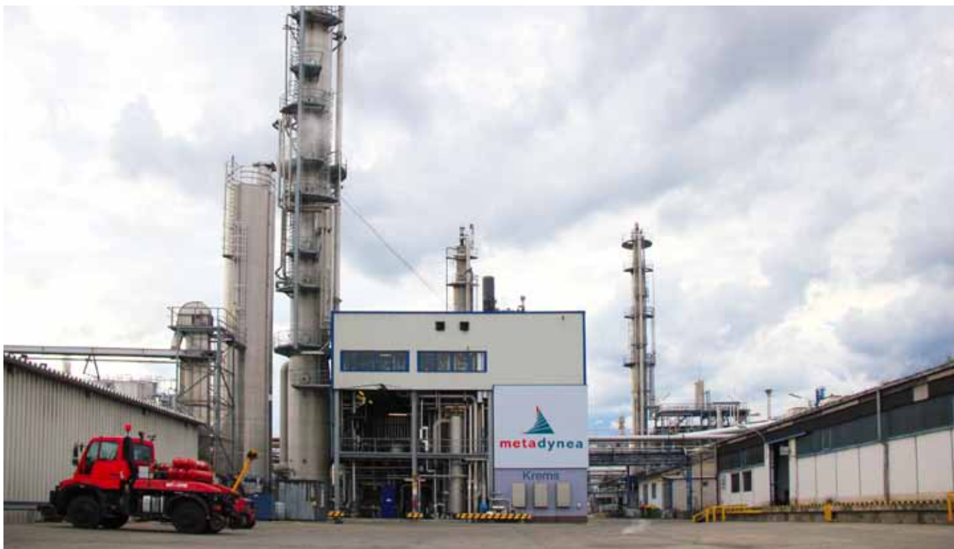
На территории технопарка «Метадина Австрия» расположено более пяти предприятий