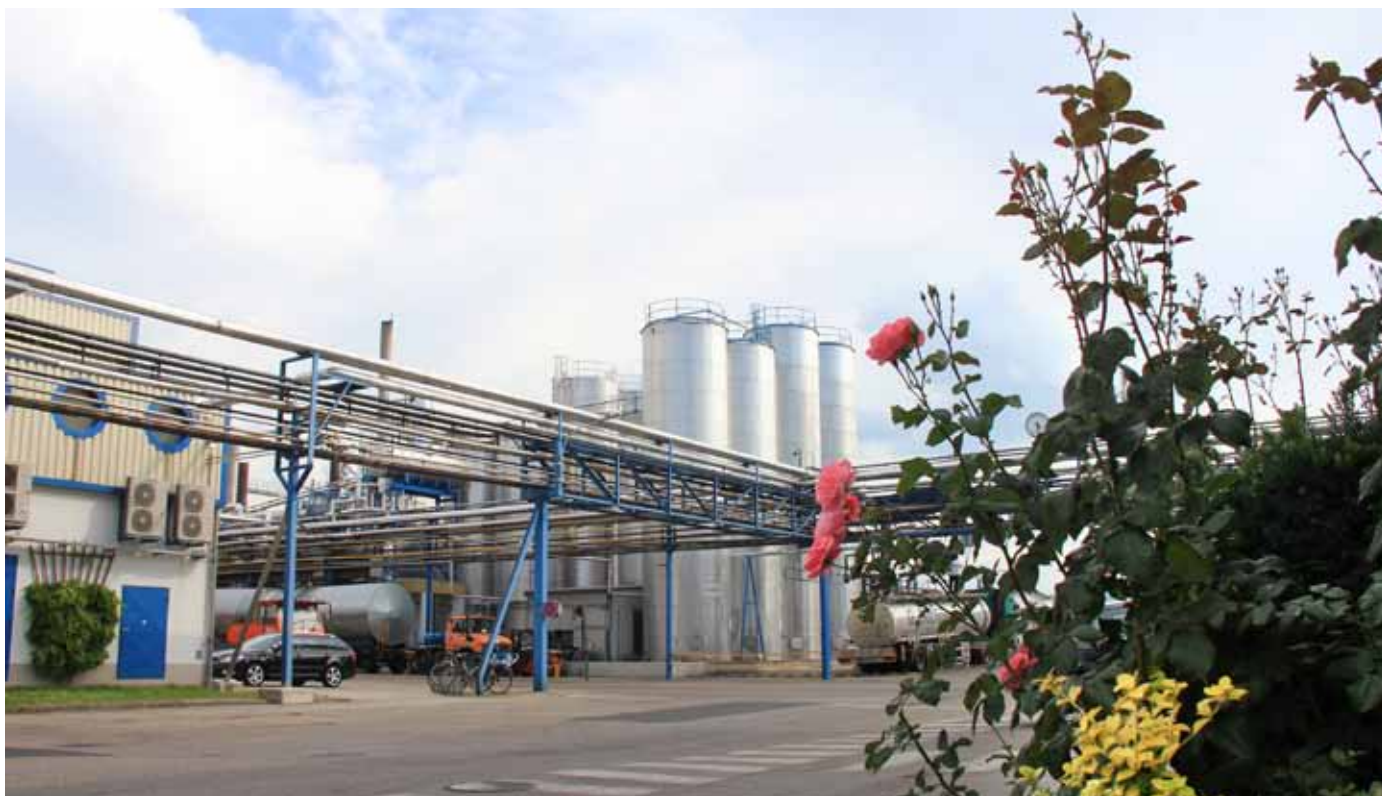
Особое внимание – промышленной безопасности и благоустройству. На территории завода цветут розы