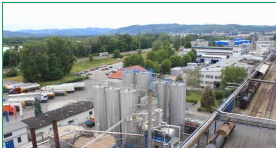
С колонны цеха формалина открывается вид на город, Дунай и горный монастырь Геттвайг