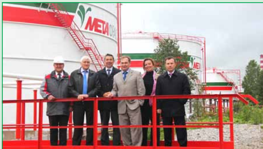
В рамках очного заседания члены Совета директоров посетили промышленные объекты предприятия: производство метанола и новую установку микронизации пентаэритрита с уротропином.

ЧИСТАЯ ПРИБЫЛЬ , полученная компанией за январь-июнь, составила 1760