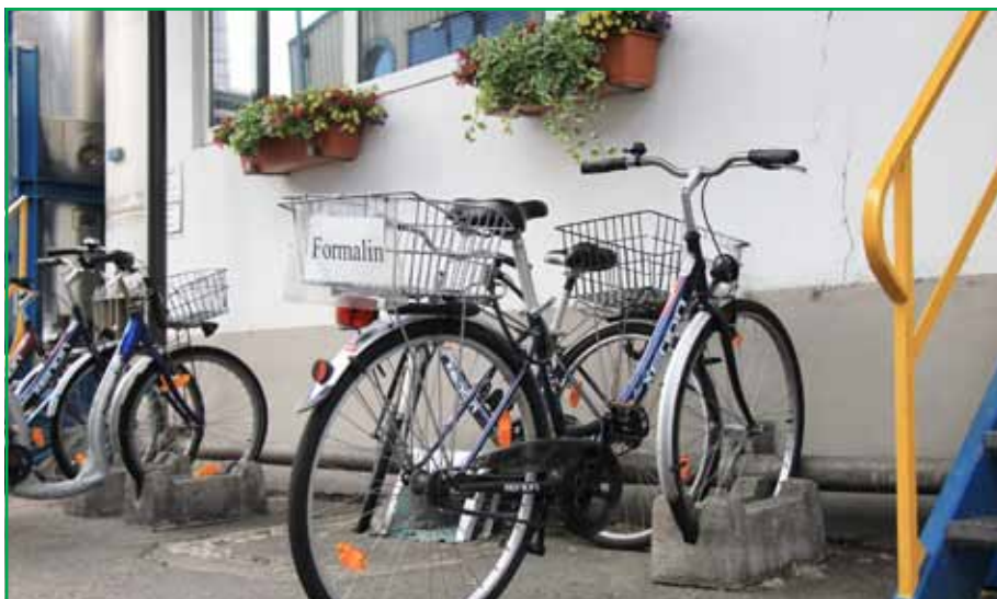
Основное средство передвижения сотрудников цехов по территории предприятия – велосипеды. Экологично и спортивно

Так как доля сырьевых затрат для этих смол составляет более 60%, особенно важной задачей для исследовательской лаборатории является развитие нового поколения смол, гарантирующих те же характеристики при более низкой доле материальных затрат. Другой важной исследовательской задачей является дальнейшее развитие смол с низкой эмиссией, важность которых будет возрастать в связи с изменениями в экологических требованиях.