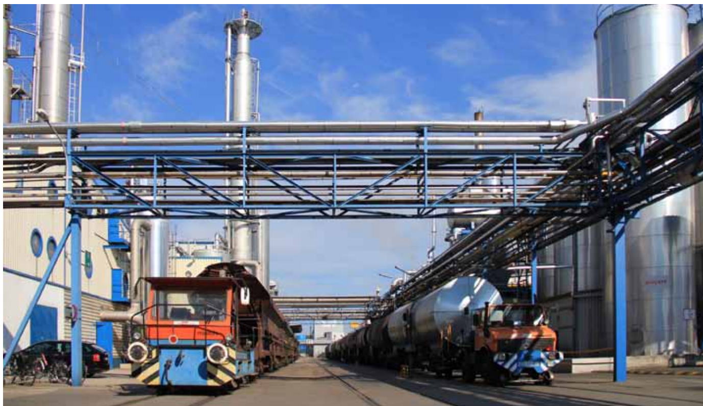
Львиная доля продукции австрийской «Метадинеа» перевозится железнодорожным транспортом

«Метадинеа Австрия» производит энергию, которой обеспечивает более 70% потребности индустриального парка