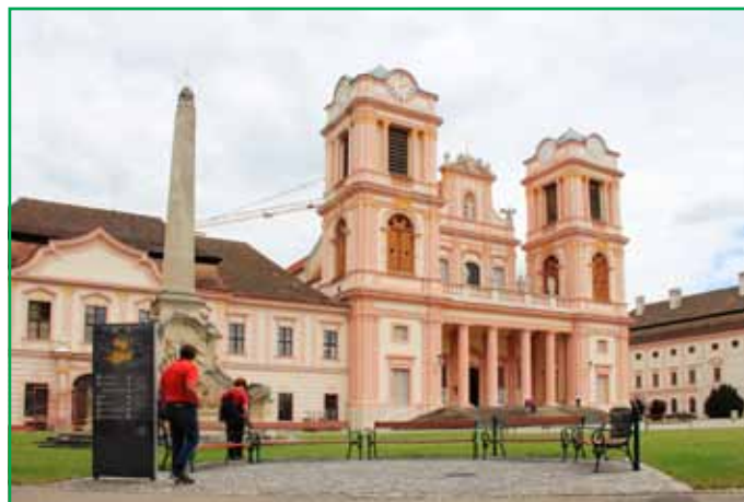
В часовне Альтманна – ларец со святыми мощами

Государство поддерживает церковь, в стране существует однопроцентный церковный налог, который обязаны платить все граждане страны (гражданин освобождается от уплаты налога по письменному заявлению об отказе от католичества).