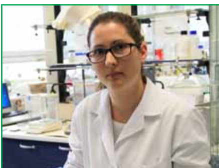
Научно-исследовательская лаборатория компании занимает здание в 4 этажа и экипирована по последнему слову науки и техники