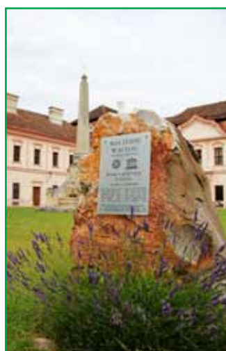
В 2000 году монастырь Геттвайг внесен в список мирового культурного наследия ЮНЕСКО

Для святого Бенедикта из Нурсии, основателя монашеского ордена, было доброй традицией принимать гостей еще полторы тысячи лет назад. Когда он писал свои правила в Монте-Кассино, он уделил особое внимание благополучию гостей и таким образом заложил основу для буквально ставшего поговоркой «бенедиктинского гостеприимства».