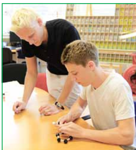
Особое внимание на «Метадина Австрия» уделяют работе со школьниками и студентами