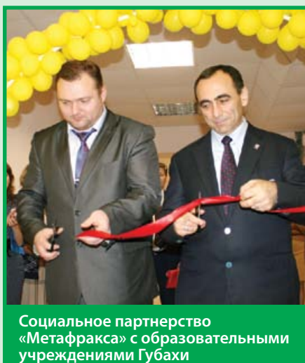
Социальное партнерство «Метафракса» с образовательными учреждениями Губахи