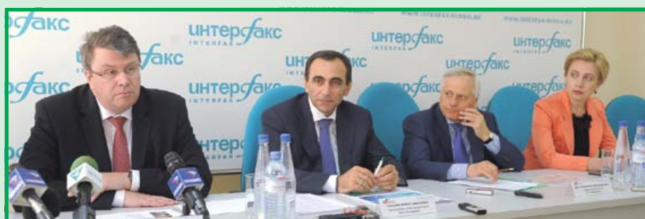
Пресс-конференция с представителями федеральных и региональных СМИ о планах и перспективах группы компаний «Метафракс»