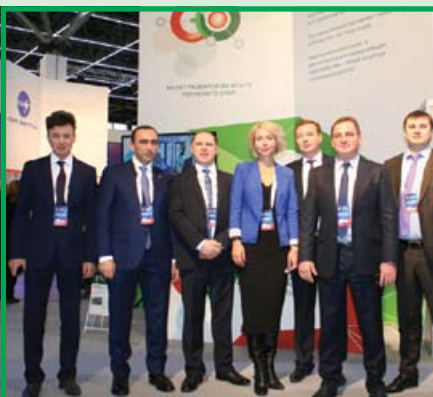
«Метафракс» на Пермском инженерно-промышленном форуме