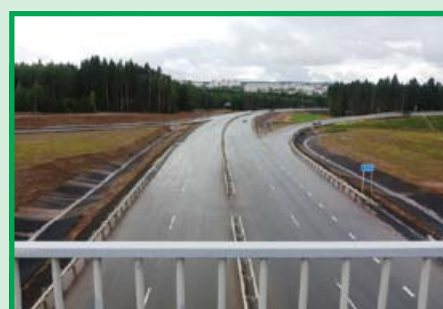
Новая развязка от дорожностроительной компании «Химспецстрой»