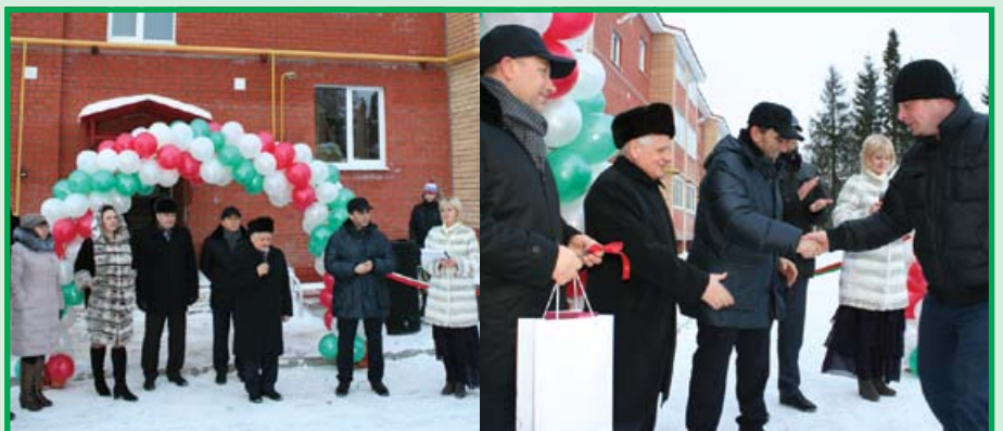
Сдача новостройки для сотрудников