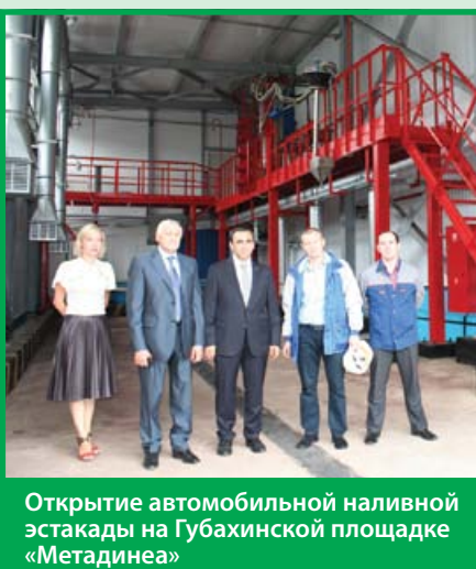
Открытие автомобильной наливной эстакады на Губахинской площадке «Метадина»