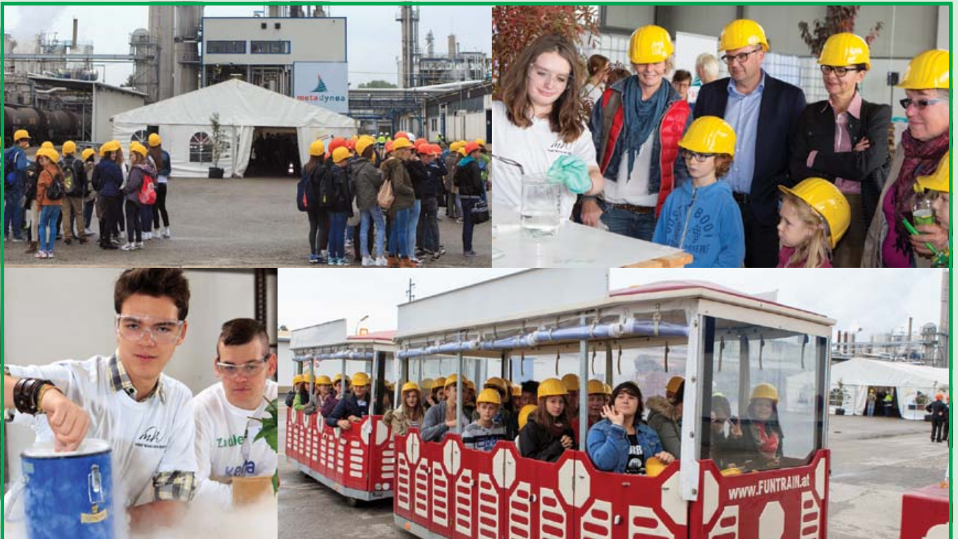
День открытых дверей в компании «Метадина» - Австрия