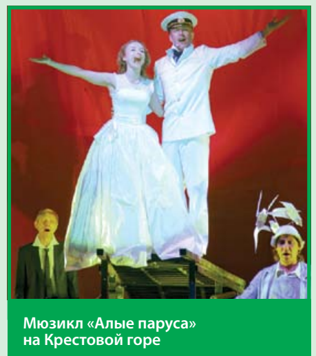
Мюзикл «Алые паруса» на Крестовой горе