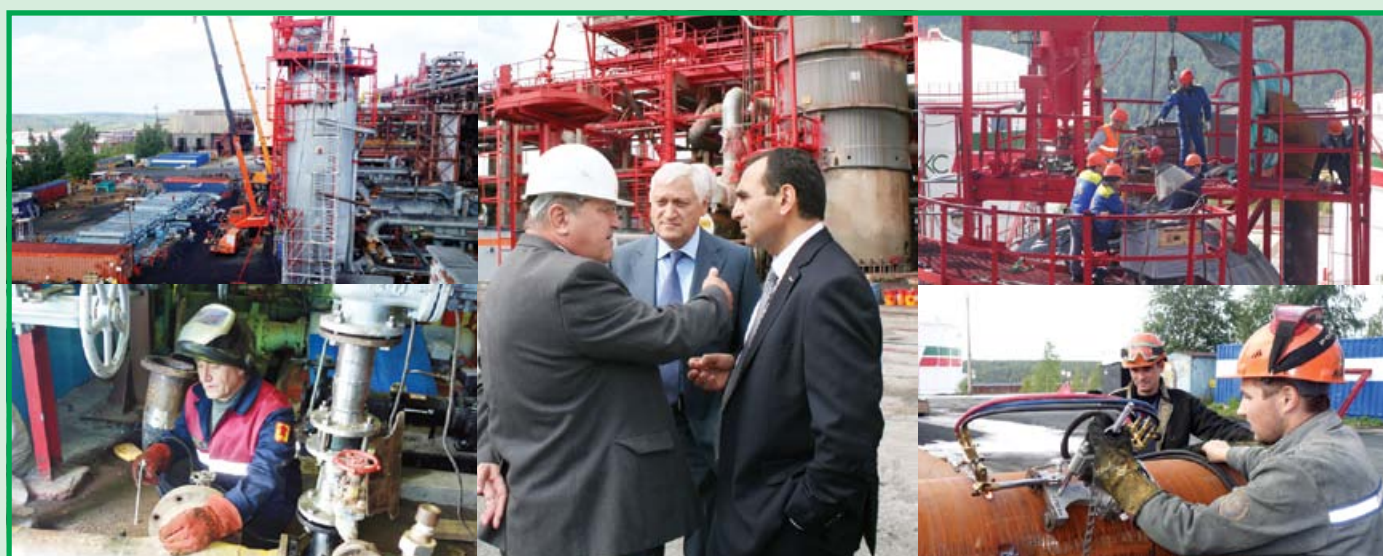
Остановочный ремонт агрегата метанола в компании «Метафракс»