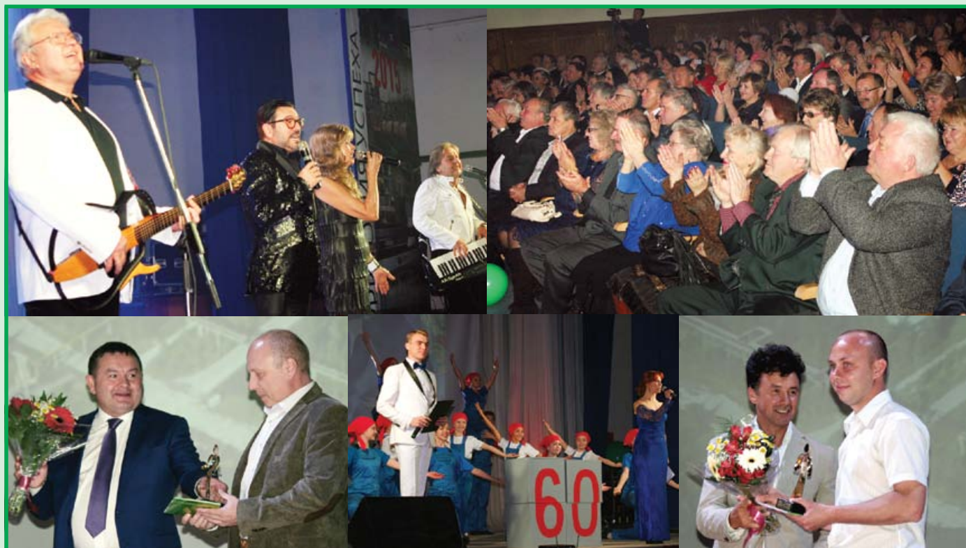
60-летний юбилей компании «Метафракс» и вручение ежегодной корпоративной премии «Человек года»