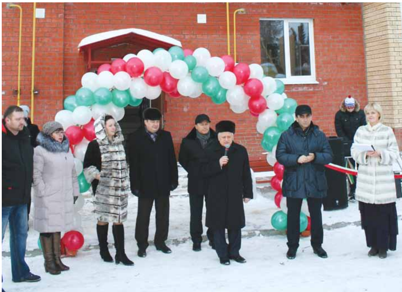
Руководство «Метафракса» пожелало новоселам счастья, тепла и семейного уюта.