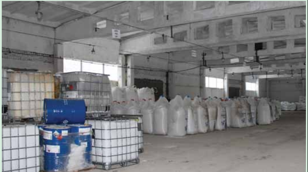
Карбамид и меламина в мешках и биг-бэгах аккуратно расположились на просторных складских площадях.