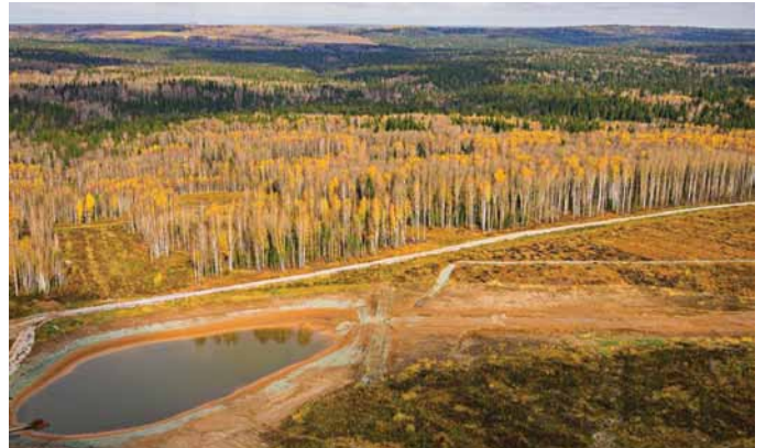
В рассолосборник калийного рудоуправления стекает рассол с отвала, в дальнейшем он используется для производственных нужд. На его обустройство требуется немало сил и средств. Вид с высоты 300 м.

Затем строители обустроили на проезжей части дорожную «одежду» по особым типам, уложили железобетонную водопропускную трубу диаметром 1 м и установили для облегчения труда водителей спецтранспорта дорожные знаки и сигнальные столбики.