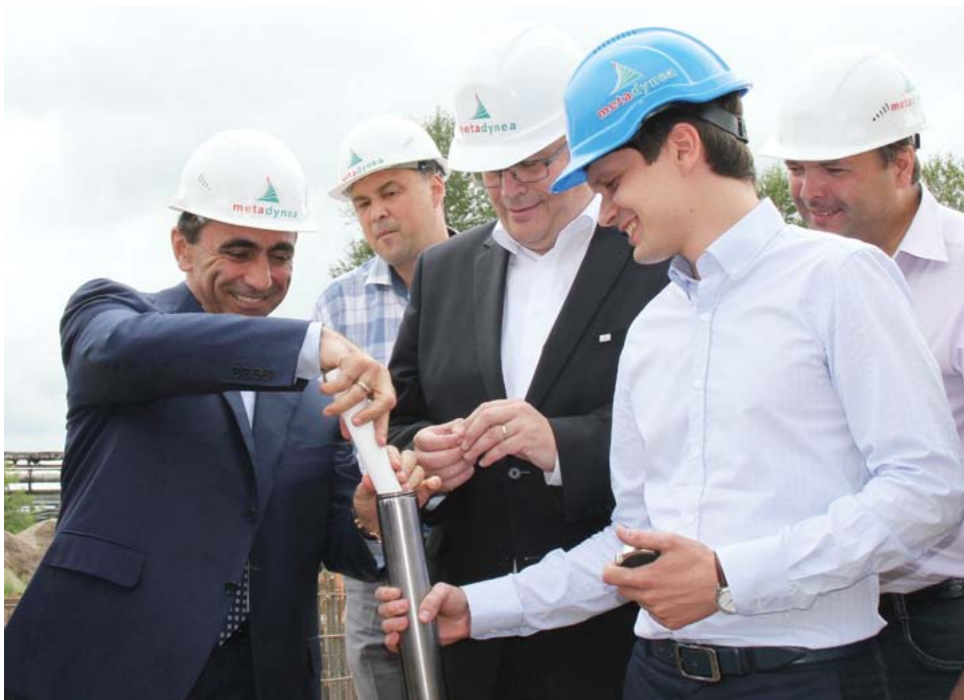
Торжественный момент закладки капсулы времени – послания сподвижников химического производства коллегам в будущее.