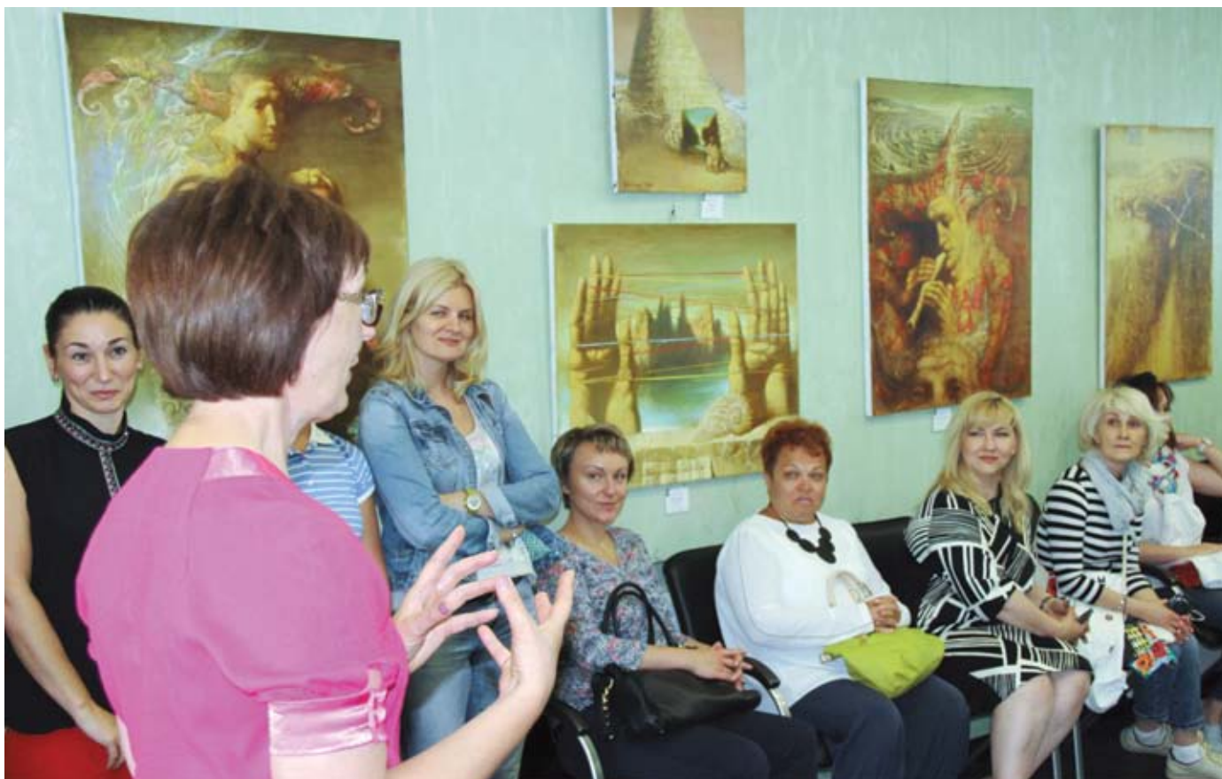
Картины живописца из Санкт-Петербурга Армена ГАСПАРЯНА волновали и тревожили душу.

– подборку работ философичного и загадочного живописца «Лабиринты времени», посвятив её 75-летию города», – объявила ведущая.