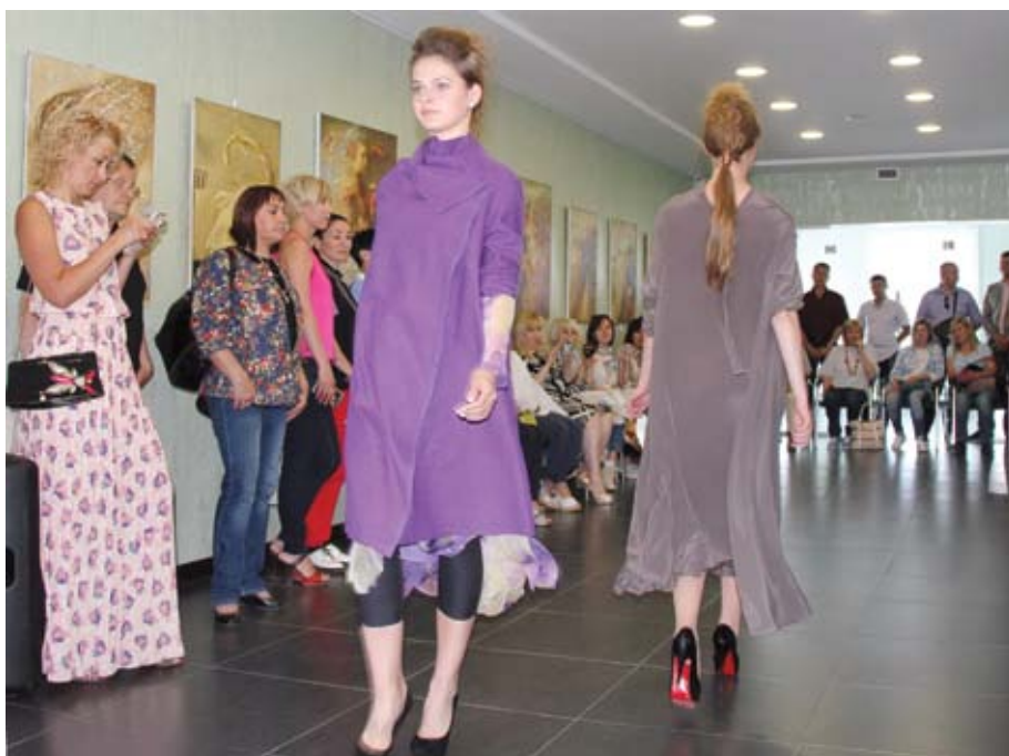
Дефиле сотрудниц Дома моды «Elena Starikova Fashion House» вызвало волну восторга любителей модных новинок.