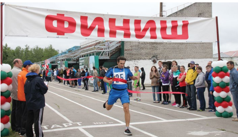
Победный финиш бессменного лидера легкоатлетической эстафеты – команды производства метанола.