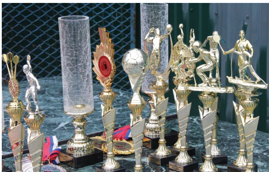
Россыпь спортивных наград в ожидании своих обладателей.

Торжественная часть завершилась, награды нашли своих героев, но самое интересное еще впереди. Целый год участники копили силы, а болельщики – эмоции для 47-й легкоатлетической эстафеты, посвященной профессиональному празднику, Дню химика. Удастся ли в этом году