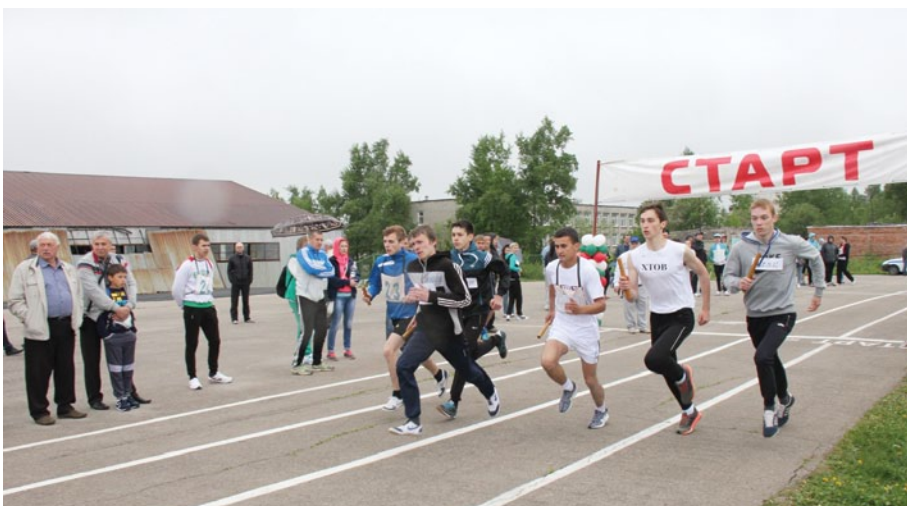
Старт юношей – учащихся губахинских школ и УХТК.

СОЛНЕЧНАЯ ПОГОДА сменила пасмурную, а спортивный праздник химиков продолжился. После эстафеты на нескольких площадках комплекса прошли состязания по мини-футболу, стритболу, дартсу