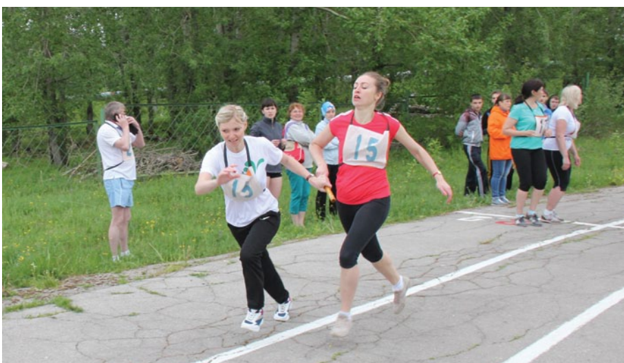
Передача эстафетной палочки спортсменок команды управления – лидера эстафеты.

и пляжному волейболу. Завершился день футбольным матчем первенства Пермского края. Встреча между командами «Ме-