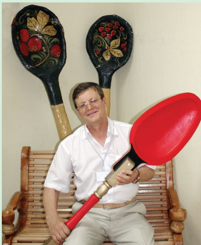
В единственном в мире Нытвенском музее ложки собраны более 2 тысяч изделий – от огромных размеров до малых ложек из створок жемчужных раковин.

В РАМКАХ ВСТРЕЧИ главный редактор журнала