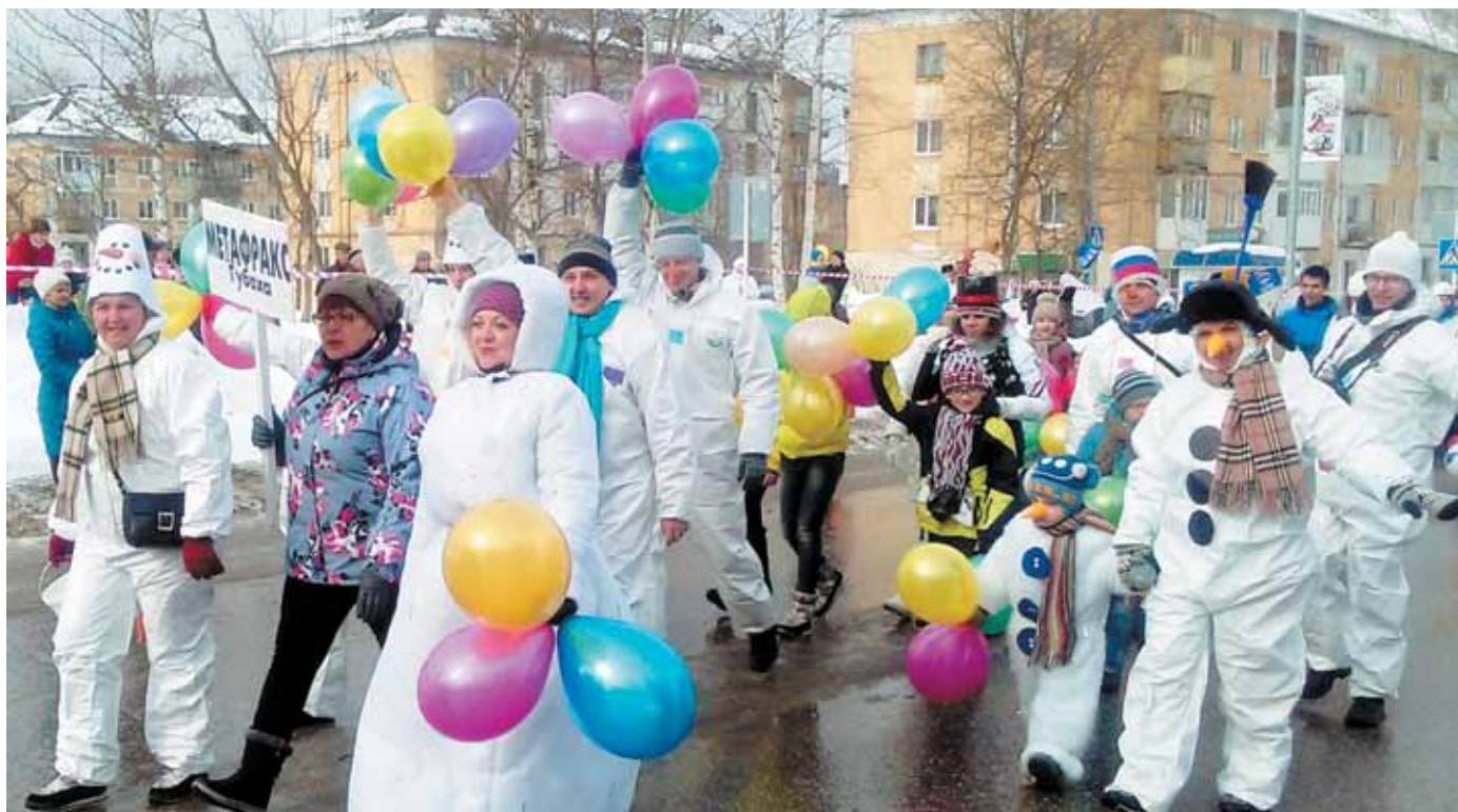
Шествие «Губахинский снеговик» получилось интересным и массовым. Активное участие в шоу приняли и работники «Метафракса».