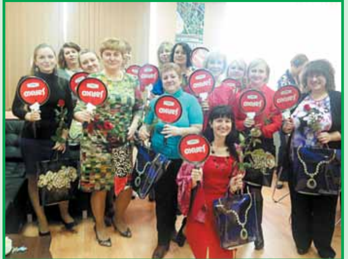
Прекрасная половина подмосковной смольной площадки «Метадинеа» с подарками от коллег-мужчин