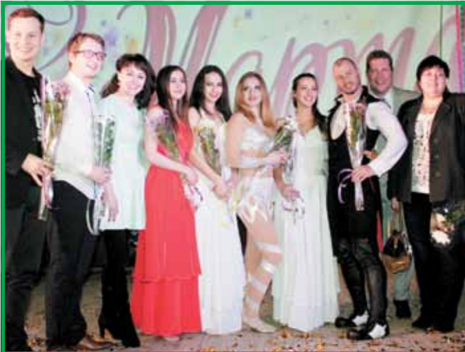
В завершение концерта артисты весело позировали вместе с сотрудницами «Метафракса»