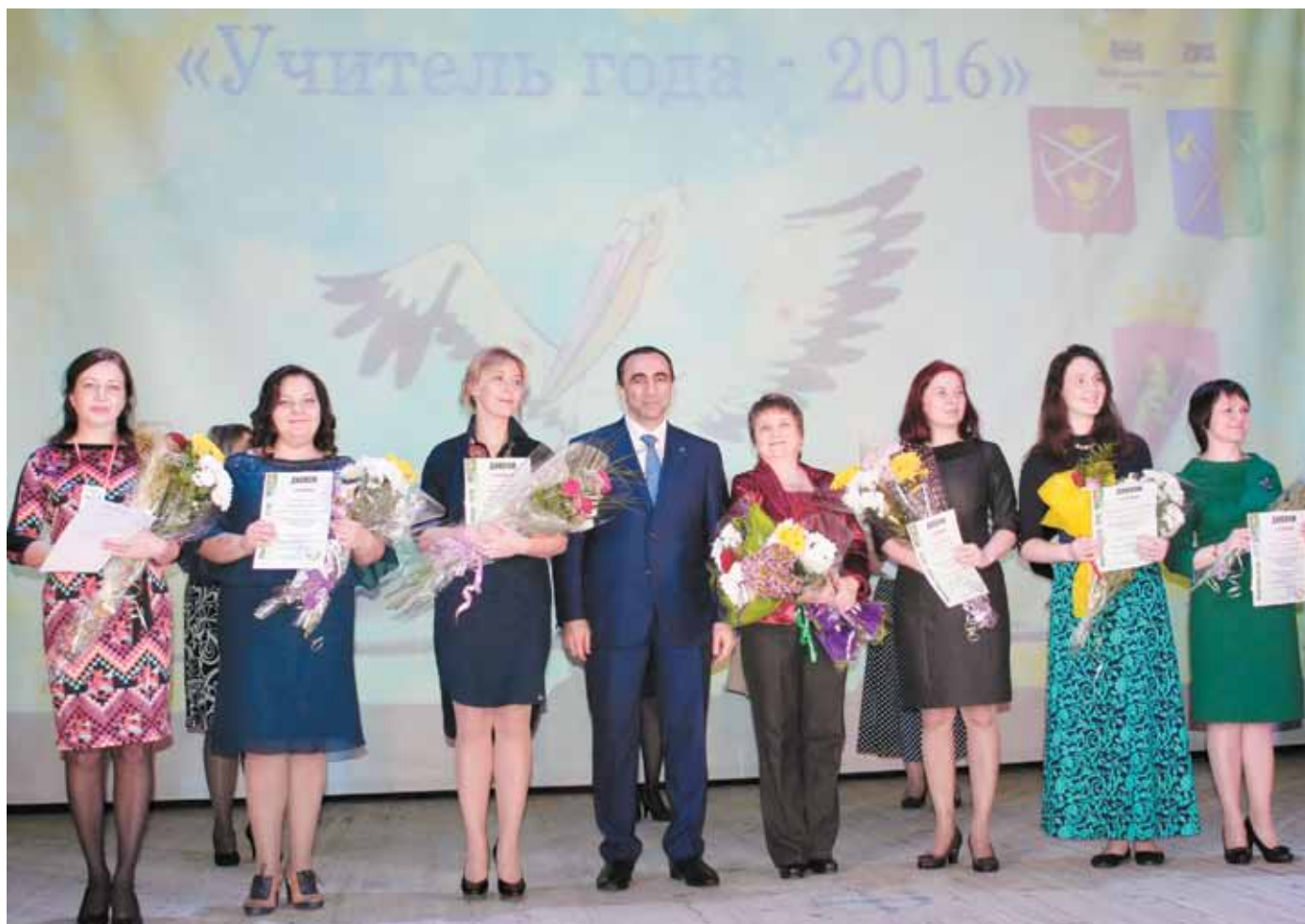
Фото на память с «золотыми» призёрами Всероссийского конкурса.