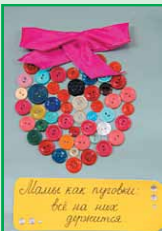
Подарок от Димы Неклюдова, победителя мартовского конкурса детских рисунков