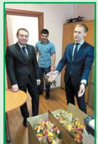
Нежные тюльпаны для сотрудниц ТД «Метафракс»