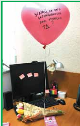
Весенние сюрпризы от мужчин ТД «Метафракс»