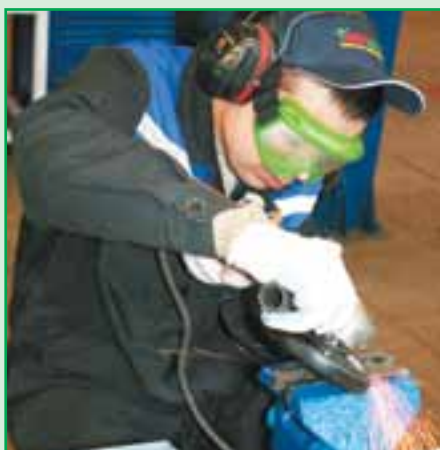
Слесарям-ремонтникам предстояло изготовить сложную деталь.