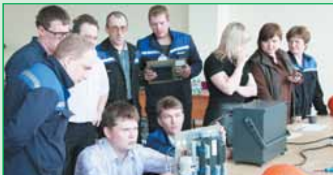
Жюри определяет качество практических работ участников конкурса профмастерства среди электромонтеров.