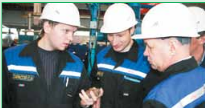
Работники ОТК выразили претензии к качеству работы отдельных конкурсантов.