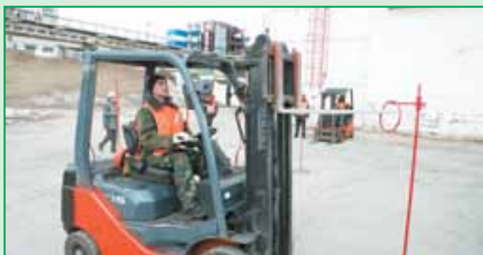
Водители автопогрузчиков с ювелирной точностью снимали кольцо со стойки.