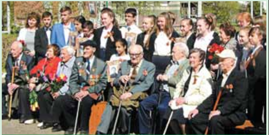
Учащаяся молодежь тепло поздравила с праздником ветеранов ОАО «Карболит».

Празднование 70-й годовщины Победы в Орехово-Зуеве началось с возложения венков и цветов к Братской могиле и молебна на мемориале павшим защитникам Отечества.