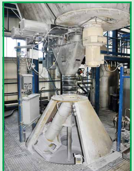
Цех по производству смол № 17: бункер автоматически дозирует карбамид или меламина в шесть реакторов