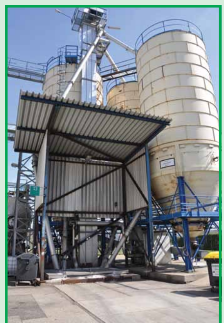
Пункт разгрузки карбамида из автомашин