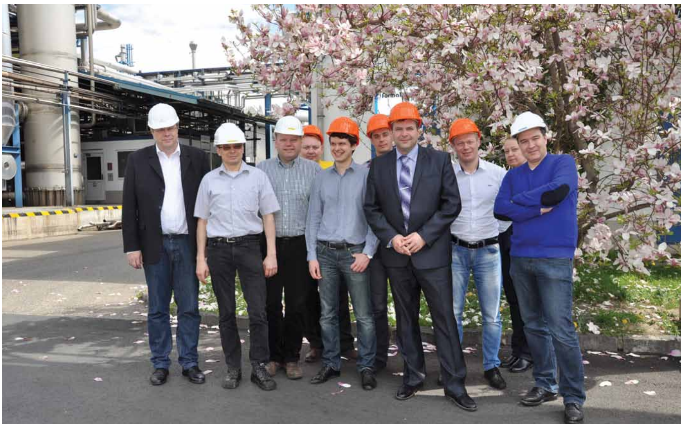
Из окон заводоуправления видна сакура. Интернациональная команда «Метадинеи» на фоне легендарного восточного дерева