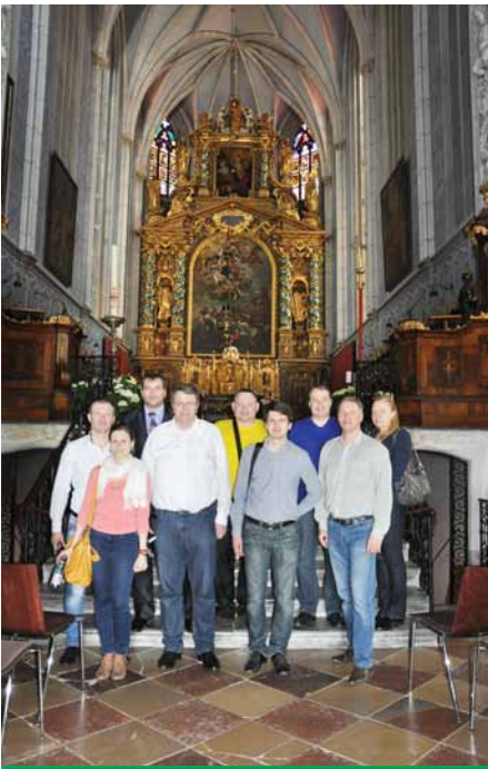
Бенедектинский монастырь Геттвайг

На основе полученных данных в ближайшей перспективе предстоит подготовить сравнительный анализ, выбрать лучшие технологические решения, реализованные в Кремсе, для дальнейшего внедрения на всех площадках. Осенью планируется провести подобную встречу этим же составом, чтобы оценить первые шаги модернизации российских промплощадок. Итогом же совместной работы должна стать долгосрочная программа – основа развития всех подразделений компании «Метадинеа» в России и в Австрии.