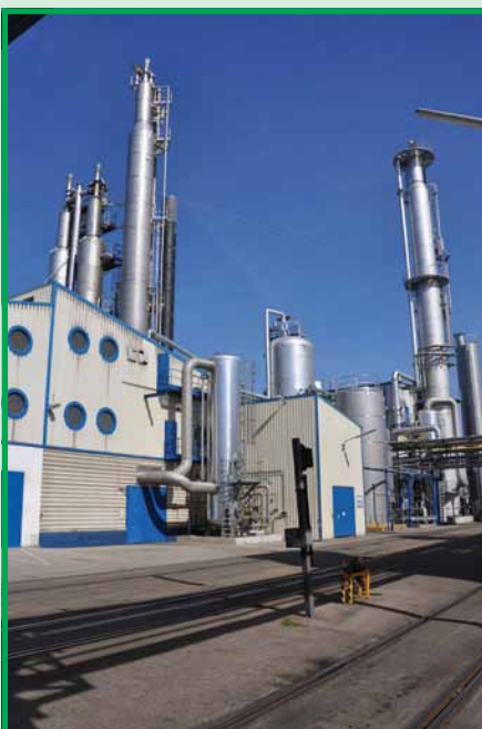
Установка формалина «Метадинеа-Австрия»