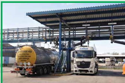
Налив смолы в автоцистерны производится силами водителей. Участие техперсонала не требуется