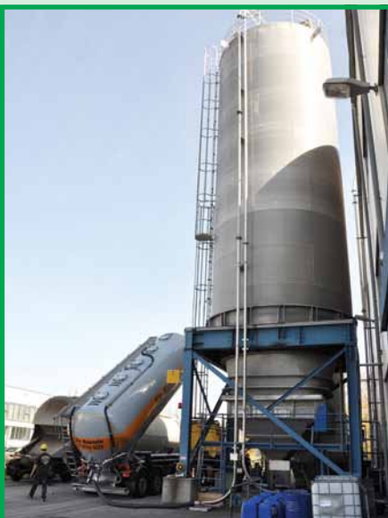
Загрузка меламина в хранилище. Цех по производству смол №17