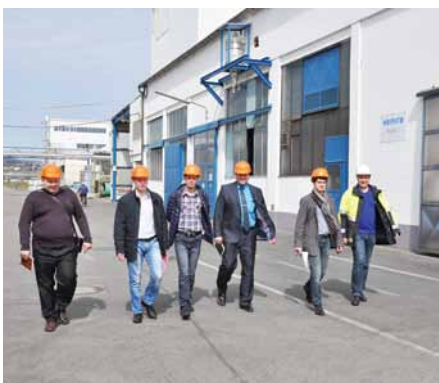
Экскурсия по индустриальному парку «Метадинеа-Австрия»