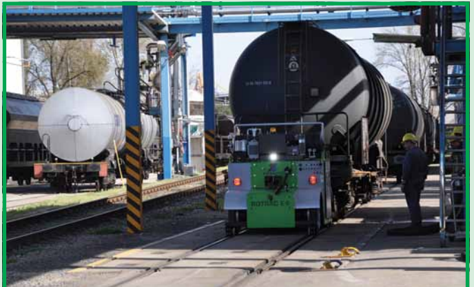
Многофункциональный перевозчик химических продуктов Rotrac может передвигаться и по железнодорожным путям, и по автодороге